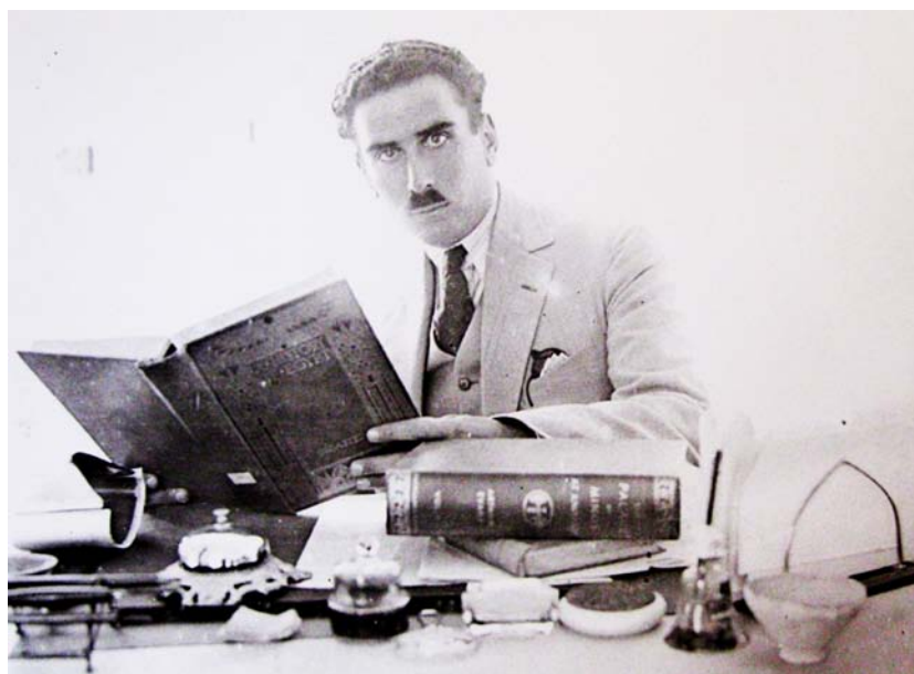
Εικ. 3. Σπυρίδων Μαρινάτος (1901-1967).

Τις δύο αρχαιολογικές Περιφέρειες θα κρατήσει ο Ξανθουδίδης μέχρι και το 1925, οπότε θα περιοριστεί ξανά στην 9η Περιφέρεια, ύστερα από την έλευση του Σπυρίδωνος Μαρινάτου στην Κρήτη ως Εφόρου της 10ης Αρχαιολογικής Περιφέρειας (Εικ. 3).