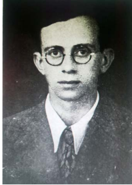
Εικ. 5. Νικόλαος Πλάτων (1909-1992).