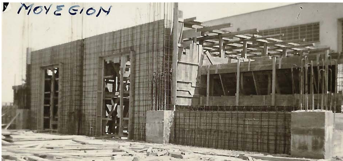
Εικ. 10. Εργασίες ανέγερσης του Νέου Μουσείου Ηρακλείου (1936 κ.ε.).