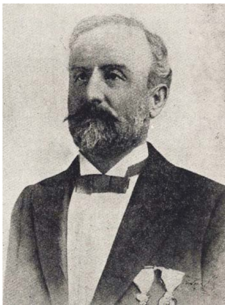
Εικ. 1. Ιωσήφ Χατζιδάκης (1845-1936).