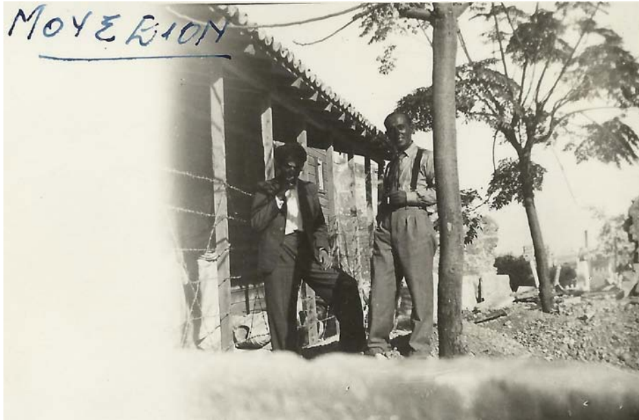
Εικ. 9. Εργασίες ανέγερσης του νέου Μουσείου. Στο βάθος το μισοκατεδαφισμένο παλιό μουσειακό κτήριο και κάτω από τα παραπήγματα τα πρόχειρα στοιβαγμένα αρχαία (!).

παραμονής του ως Επιμελητής στην Κρήτη ο Πλάτων αποτέλεσε πάντως το δεξί χέρι του Εφόρου Μαρινάτου, σε μια περίοδο που μάλλον είναι η γονιμότερη της θητείας του δεύτερου στην Κρήτη. Ξεχωριστής αξίας είναι η συμβολή του Πλάτωνα στον αγώνα για την περισυλλογή των πολύτιμων ευρημάτων από το σπήλαιο του Αρκαλοχωρίου, που μετά τη λεηλασία του βρισκόταν στα χέρια ντόπιων και ξένων αρχαιοκαπήλων (Μαρινάτος, 1935). Μπορούμε και να εικάσουμε άλλωστε τη συμβολή του Πλάτωνα στην αντιμετώπιση των σεισμικών καταστροφών του 1930 και ιδίως του 1935, οι συνέπειες των οποίων οδήγησαν σε μεγάλες και επίπονες ανακατατάξεις στο Μουσείο, εδραιώνοντας στη σκέψη του Μαρινάτου την ιδέα της κατασκευής του νέου, μεγαλειώδους στη σύλληψή του –για την εποχή εκείνη– κτηρίου του Μουσείου Ηρακλείου (Τζωράκης, 2014).