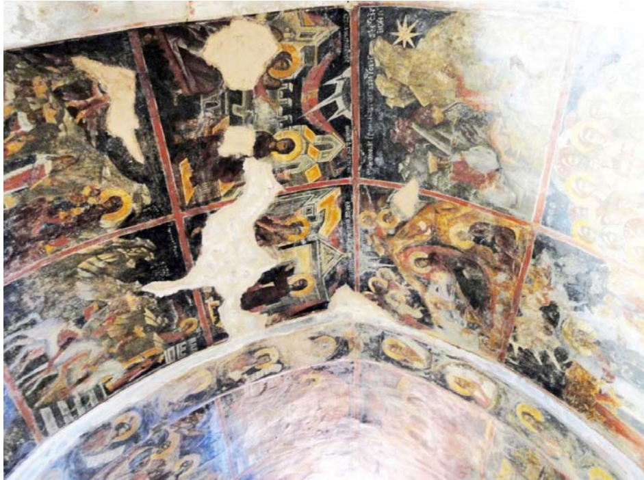
Εικ. 3. Βαλσαμόνερο, Μονή Αγίου Φανουρίου, κλίτος Παναγίας. Σκηνές από τον κύκλο του Ακαθίστου Ύμνου. Τοιχογραφίες γύρω στα 1430.

αφιερωμένη στον Άγιο Ιωάννη κωνσταντινουπολιτική Μονή του Στουδίου, πρότυπο πνευματικού ιδρύματος στη βυζαντινή κοινοπολιτεία και τόπο φύλαξης της κάρας του Βαπτιστή, και τον συνέδεε πολιτιστικά με την Πόλη των Πόλεων. 17