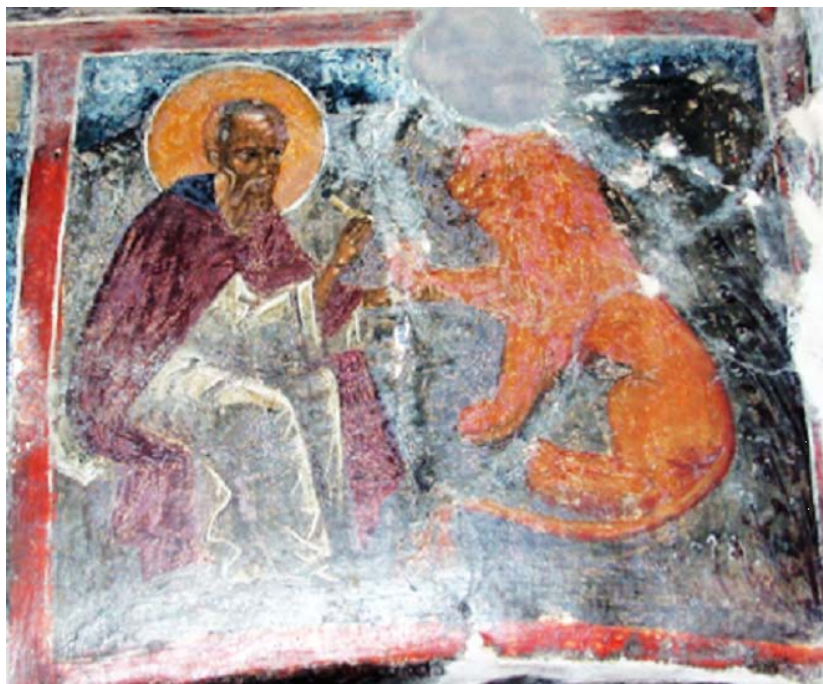
Εικ. 5. Βαλσαμόνερο, Μονή Αγίου Φανουρίου, κλίτος Παναγίας.

παραδείγματα μοναχισμού υπό ησυχαστικό πρίσμα, όπως του Αγίου Γερασίμου που δαμάζει λιοντάρι, βλ. Τριανταφυλλόπουλος (2005), 244, υποσ. 64· Βοκοτόπουλος (1998-1999), 291 κε.