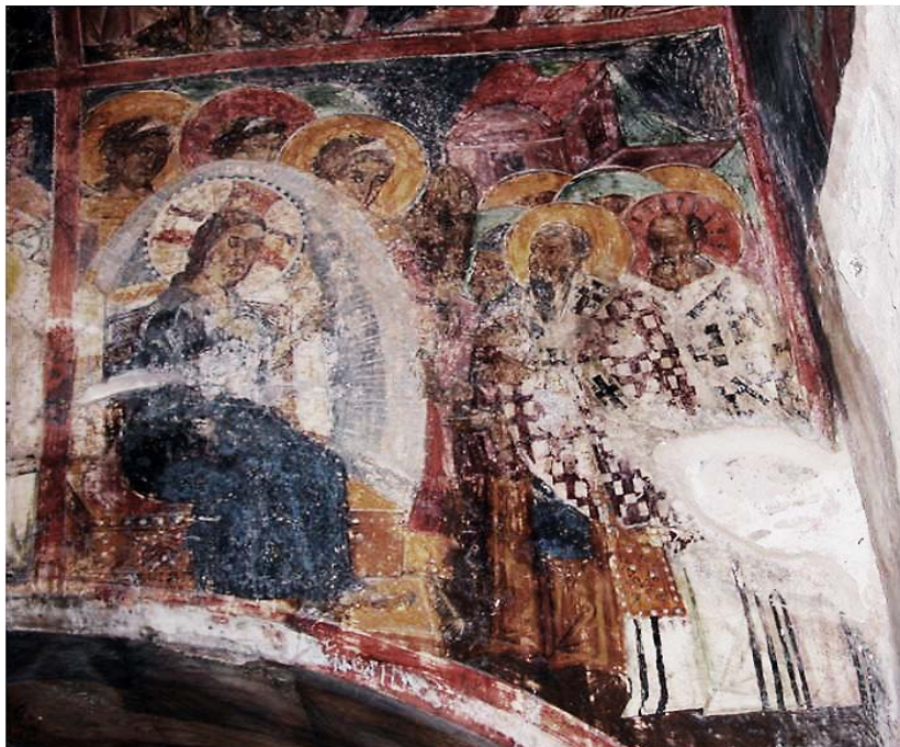
Εικ. 4. Βαλσαμόνερο, Μονή Αγίου Φανουρίου, κλίτος Παναγίας. Ακάθιστος Ύμνος, Οίκος 20: «Ύμνος ἅπας ἠττάται...». Τοιχογραφία γύρω στα 1430.