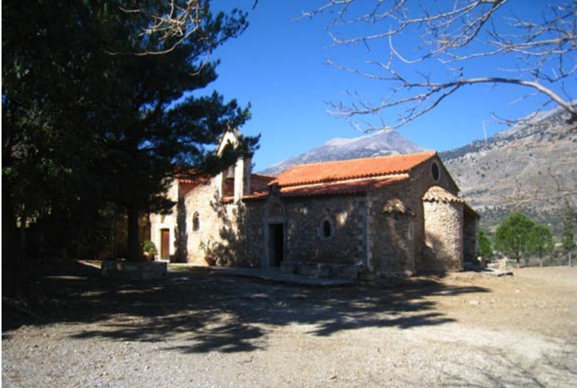
Εικ. 1. Βαλσαμόνερο, Μονή Αγίου Φανουρίου: άποψη από νοτιοανατολικά. 1

στην εικονογραφία και στη θεολογία. 2 Ως ιστορικά και πολιτισμικά σημεία αναφοράς για τη μορφολογική και εικονολογική προσέγγιση των τοιχογραφιών θα χρησιμοποιηθούν τα δύο μεγέθη του ύστερου Μεσαίωνα, το Βυζάντιο και η ιταλική Δύση. 3 Η προσέγγιση επιδιώκει να συμβάλει στον επιστημονικό διάλογο για τα πνευματικά συστήματα του 14ου/15ου αιώνα, περίοδος κατά την οποία η Κρήτη προσέφερε ένα διαπολιτισμικό και κοινωνικο-οικονομικά ελκυστικό περιβάλλον για καλλιτέχνες και λόγιους Κρήτες, Βενετούς και παρεπιδημούντες Κωνσταντινουπολίτες. 4