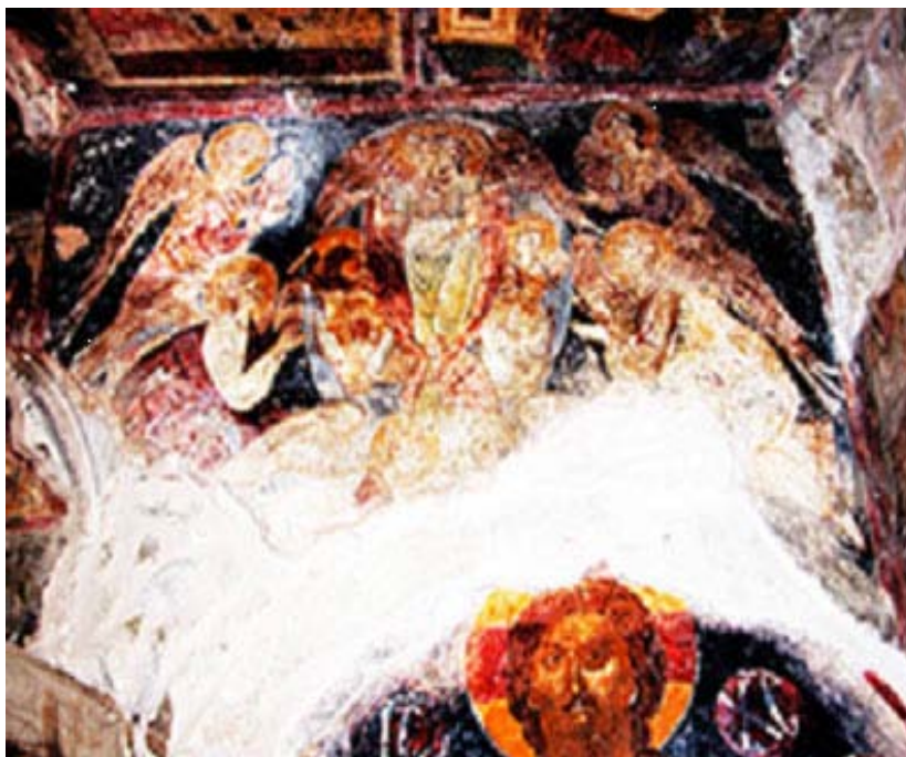
Εικ. 6. Βαλσαμόνερο, Μονή Αγίου Φανουρίου, κλίτος Αγίου Φανουρίου. Τρικέφαλη Αγία Τριάδα, Χριστός Παντοκράτωρ. Τοιχογραφίες του 1431.

Ενδεικτικός της ενίσχυσης ησυχαστικών απόψεων είναι και ο ευχαριστιακός-θεοφανειακός ρεαλισμός που χρωματίζει την εικονογραφία του ιερού βήματος στο κλίτος του Φανουρίου. Περίπλοκο είναι μεταξύ άλλων το ερώτημα ποιοι προβληματισμοί ενέπνευσαν την αλληγορική σύνθεση της τρικέφαλης αγγελικής θεότητας στο μέτωπο της αψίδας του ιερού (Εικ. 6), η οποία στη σχετική βιβλιογραφία περιγράφεται τις περισσότερες φορές λακωνικά ως Αγία Τριάδα δυτικού τύπου. 21