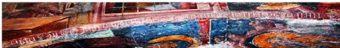
Εικ. 14. Βαλσαμόνερο, Μονή Αγίου Φανουρίου. Επιγραφή στο κλίτος του Αγίου Ιωάννη Προδρόμου με τοιχογραφίες του 1428.

Στο εκπονούμενο πρόγραμμα θα αποσαφηνιστεί η εικαστική μετουσίωση θεολογικών-φιλοσοφικών πεποιθήσεων και θα διαλευκανθούν ζητήματα υπό συζήτηση στη σύγχρονη έρευνα. Πέρα από τη διαλογή και ανάλυση των αρχειακών και αρχαιολογικών δεδομένων σε συστοιχία με τις διαφορετικές φάσεις δόμησης και τοιχογράφησης του μνημείου, θα ήθελα να επισημάνω και πάλι την εικονολογία του διακόσμου. Η ερμηνεία του, όπως έδειξε το παράδειγμα της τρικέφαλης Αγίας Τριάδας, υπόσχεται διαφοροποιημένα και ασφαλέστερα συμπεράσματα.