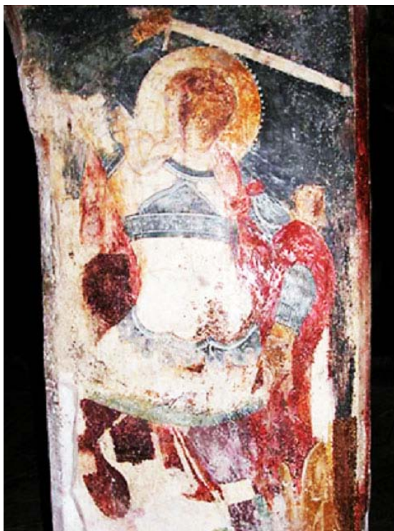
Εικ. 13. Βαλσαμόνερο, Μονή Αγίου Φανουρίου, κλίτος Αγίου Φανουρίου: Ο Φανούριος ως στρατιωτικός άγιος. Τοιχογραφία του 1431.

στο Βαλσαμόνερο από τον 15ο αιώνα (Εικ. 13). 36 Η ως τώρα διερεύνησή της σε συνάρτηση με παραστάσεις του σε εικόνες-έργα του ζωγράφου Αγγέλου, 37 πιστεύω ότι θα δώσει, αν συνδυαστεί προς τη συγκριτική μελέτη των τοιχογραφιών του εγκάρσιου κλίτους με επεισόδια από τον βίο του, μια ολοκληρωμένη εικόνα για την πρόσληψη του νεοφανούς.