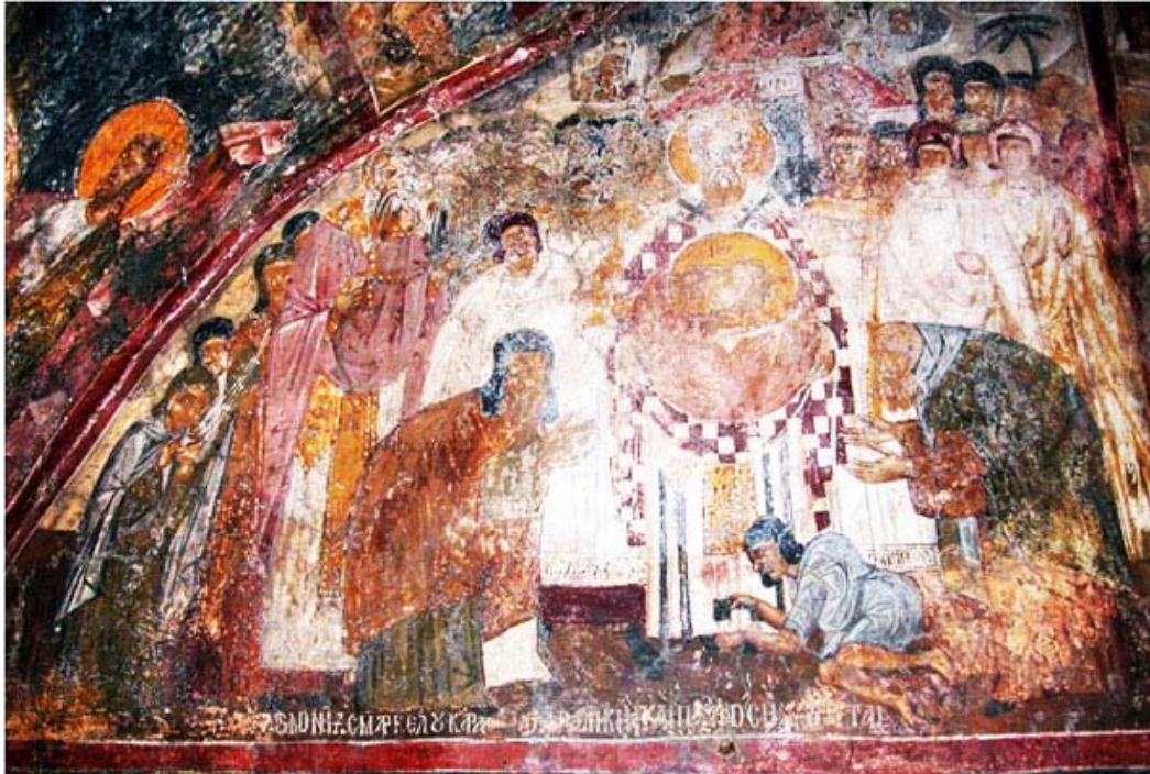
Εικ. 2. Μονή Αγίου Φανουρίου, κλίτος Αγίου Ιωάννη Προδρόμου. Η δεύτερη εύρεση της κεφαλής του Προδρόμου. Τοιχογραφία του 1428.

Αξιόλογοι υπήρξαν ο ρόλος της Μονής και η σχέση της με γειτονικές μονές, λόγου χάρη με τη Μονή του Βροντισίου, καθώς και με άλλα πνευματικά ιδρύματα που διαδραμάτισαν σημαντικό ρόλο. 13 Πολύπλευρα καταρτισμένοι οι μοναχοί του Βαλσαμόνερου δραστηριοποιούνταν ως αντιγραφείς και ασκούσαν επιρροή ως παράγοντες μεταβίβασης γνώσης. 14