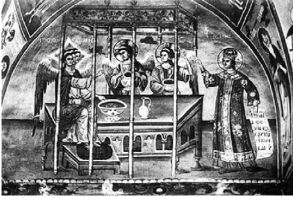
Εικ. 9. Άγιο Όρος, Καθολικό Μονής Χιλανδαρίου, «Η Σοφία ώκοδόμησεν τὸν οἶκον αὐτῆς». Τοιχογραφία του 1299.

Αυτή η ασυνήθιστη πλην όμως κατάλληλη για τη διατύπωση δογματικών θέσεων εικονογραφία της Αγίας Τριάδας ήταν προφανώς δόκιμη στους κύκλους της παλαιολόγειας διανόησης ως απόρροια των έντονων συζητήσεων και συγκρούσεων κατά τον 13ο αιώνα περί