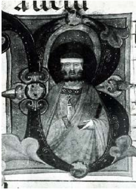
Εικ. 7. Μουσείο του San Gimignano. Τριπρόσωπη Αγία Τριάδα ( vultus trifrons ). Μικρογραφία από αντιφωνάριο του 15ου αι.