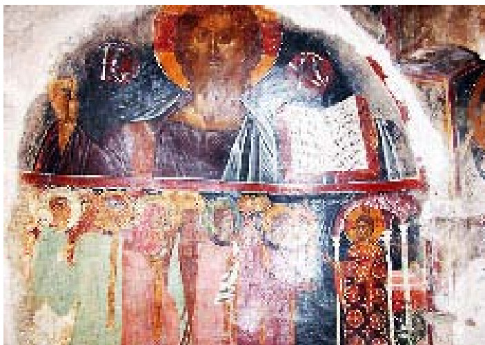
Εικ. 11. Βαλσαμόνερο, Μονή Αγίου Φανουρίου, κλίτος Αγίου Φανουρίου. Χριστός Παντοκράτωρ, Μεγάλη Είσοδος. Τοιχογραφίες του 1431.

Στο τριαδολογικό σχήμα στο κλίτος του Φανουρίου προέχει η αισθητοποίηση της σχέσης του Χριστού με την εκτός τόπου και χρόνου πραγματικότητα της Αγίας Τριάδας και τη θεϊκή ενέργειά της κατά το μυστήριο της Θείας Ευχαριστίας. Ο γνωστός από επιγραφή του 1431 ζωγράφος Κωνσταντίνος Ειρικός έχει τοποθετήσει εδώ την τρικέφαλη αγγελική μορφή σε εμφαντική θέση πάνω και την παράσταση της Μεγάλης Είσοδου με τον Χριστό λειτουργό κάτω από τον στηθαίο Παντοκράτορα