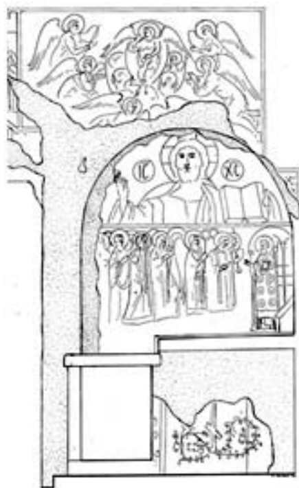
Εικ. 12. Βαλσαμόνερο, Μονή Αγίου Φανουρίου, κλίτος Αγίου Φανουρίου, σχέδιο τοιχογραφιών Ιερού Βήματος από τον Αριστείδη Χρηστάκη.

Με ένα κεντρικής σημασίας ερώτημα συνδέεται και η λατρεία του Φανουρίου που καλλιεργήθηκε