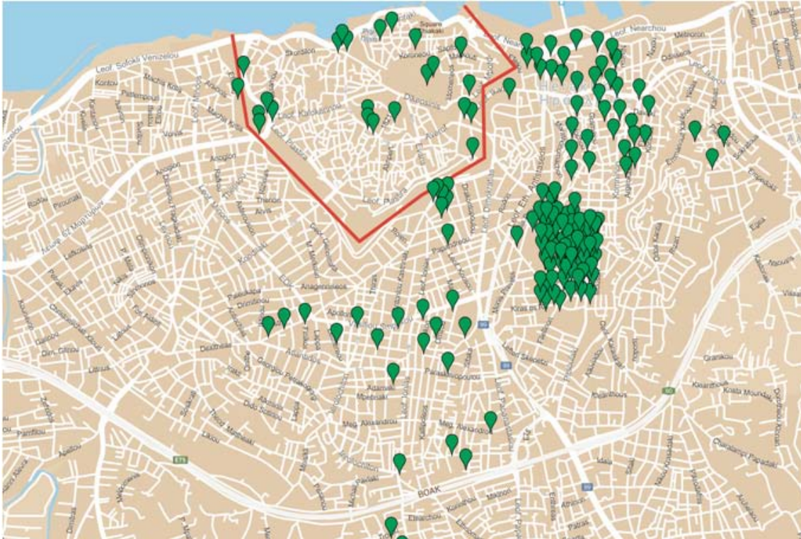
Εικ. 2. Ακίνητα (οικόπεδα και αγροτεμάχια) εκτός των τειχών που έγιναν αντικείμενο αγοραπωλησιών κατά την περίοδο 1945-1949 (επεξεργασία Google maps).

ακόμη η Χρυσοπηγή και ακόμη λιγότερο η ευρύτερη περιοχή του Τοπ Αλτί Ηρακλείου. Το ιδιαίτερο χαρακτηριστικό που παρατηρείται τη συγκεκριμένη περίοδο στις αγροτικές αυτές περιοχές, είναι η κατάτμηση μεγάλης αγροτικής περιουσίας σε μικρότερα κομμάτια, τα οποία πωλούνταν ως οικόπεδα των 100 έως 300 τετραγωνικών μέτρων κυρίως, γεγονός που καταδεικνύει την τάση για οικοπεδοποίηση μεγάλων αγροτικών εκτάσεων στην ευρύτερη εκτός των τειχών περιοχή του Ηρακλείου.