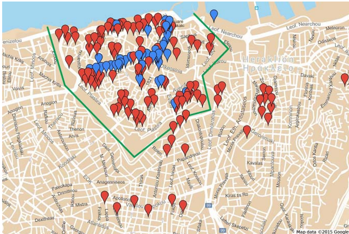
Εικ. 1. Κατοικίες (με κόκκινο χρώμα) και εμπορικά ακίνητα (με μπλε χρώμα) που έγιναν αντικείμενο αγοραπωλησιών από το 1945 ως το 1949 (επεξεργασία Google maps).

Το μεγαλύτερο ποσοστό των αγοραπωλησιών αφορά κατοικίες και πολύ λιγότερο εμπορικά ακίνητα. Οι κατοικίες που πωλούνται βρίσκονται στις παραδοσιακές συνοικίες εντός των τειχών της πόλης και χαρακτηρίζονταν στην πλειονότητά τους ως βομβόπληκτες, οι οποίες παρουσίαζαν πολλές ζημιές. Παρατηρείται, λοιπόν, η επιθυμία των ανθρώπων, ακόμη και μετά την αποκατάσταση της ειρήνης, για κατοίκηση στο ίδιο αστικό περιβάλλον που υπήρχε προπολεμικά, χωρίς να παρατηρείται ακόμη κάποια αλλαγή στον τρόπο ζωής και λειτουργίας της πόλης. Ένας μικρός αριθμός κατοικιών, που έγινε αντικείμενο αγοραπωλησιών στο εξωτερικό των τειχών, βρισκόταν σε περιοχές που ήταν ήδη δομημένες, όπως οι περιοχές που προαναφέρθηκαν, με αποτέλεσμα να μην έχει μεταβληθεί το αστικό τοπίο της πόλης από την προπολεμική εποχή. Σε κάθε περίπτωση πάντως, κατά την περίοδο 1945-1949, η προέλευση των αγοραστών κατοικιών είναι ως επί το πλείστον το Ηράκλειο και σε ποσοστό αμελητέο η επαρχία.