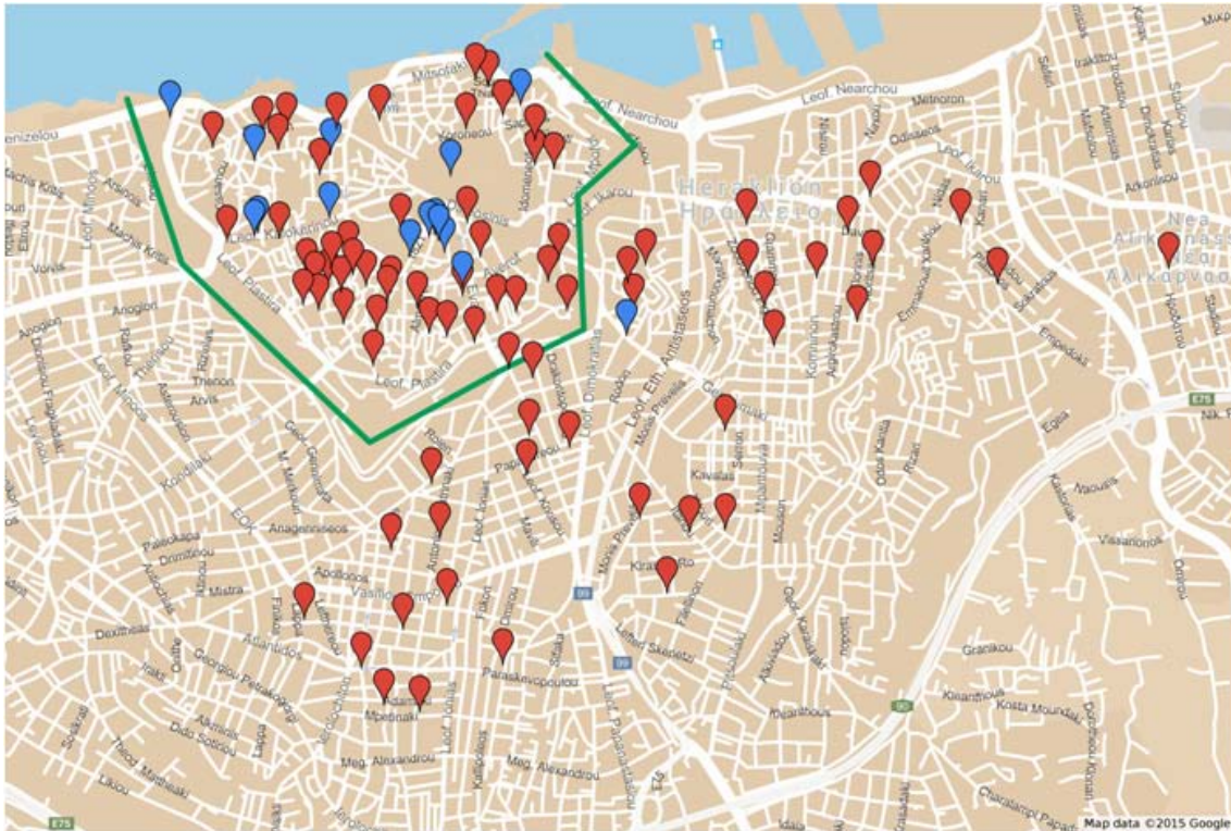
Εικ. 3. Κατοικίες (με κόκκινο χρώμα) και εμπορικά ακίνητα (με μπλε χρώμα) που έγιναν αντικείμενο αγοραπωλησιών κατά την περίοδο 1950-1959 (επεξεργασία Google maps).

Συνεπώς οι μετακινήσεις των κατοίκων που εκφράστηκαν με τις αγοραπωλησίες ακινήτων κατά την περίοδο 1945-1949 ήταν κυρίως ενδοαστικές, περιορίζονταν δηλαδή στο παλιό αστικό περιβάλλον του Ηρακλείου.