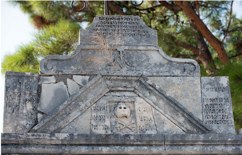
Εικ. 4. Η επιγραφή στον ναό του Χριστού στον Άγιο Μύρωνα Μαλεβιζίου.

Ο ναός του Αγίου Πνεύματος χρονολογείται από την εποχή της Ενετοκρατίας. Προφανώς ο Μαρινάκης τον επισκεύασε και κατασκεύασε το τρίλοβο πετρόχτιστο κωδωνοστάσιο. Η ποιότητα της εργασίας δείχνει εξαιρετικό λιθοξόδο. Μάλλον ο ίδιος φιλοτέχνησε και τα εντυπωσιακά λιθόγλυπτα παράθυρα της δυτικής όψης.