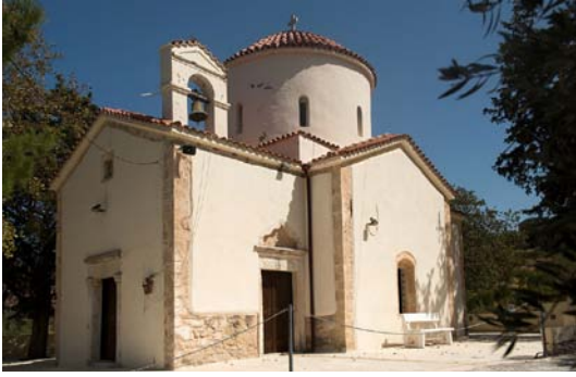
Εικ. 2. Ο ναός της Θεοτόκου στο Κεραμούτσι Μαλεβιζίου.

αλλά και όπως επιβεβαιώνουν οι αρχαιακές πηγές. 17 Πιθανότατα είναι δικό τους έργο και το πυργόσχημο κωδωνοστάσιο του καθεδρικού ναού του Αγίου Μύρωνα (Εικ. 1), με τόξα και εξώστη, εμφανώς επηρεασμένο από δυτικά πρότυπα. 18 Το επίσης πυργόσχημο μνημειακό ρολόι του χωριού, αφιέρωμα ομογενή από τις Ηνωμένες Πολιτείες, χτίστηκε από τον Φίλιππο Γιαννόπουλο κατά τις πρώτες δεκαετίες του 20ού αιώνα. Ένας άλλος χτίστης, ο Νικόλαος Βιττώρης από τις Μενετές, επισκευάζει τον ναό της Παναγίας στο Κεραμούτσι, στη θέση Γρομπόλα, στο σώχωρο του Μουσουλμάνου Αμπτίν Βέη Μουτεβελάκη (Εικ. 2). Ο ναός αυτός ήταν αρχικά μονόχωρος και τοιχογραφημένος. Τον 16ο αιώνα ανακαινίστηκε και από μονόχωρος μετατράπηκε σε ελεύθερο σταυρό με τρούλο (Μυλοποταμιτάκη 1998, 133). Κατά τον 19ο αιώνα είχε υποστεί σοβαρές ζημιές, ίσως και να είχαν καταστραφεί οι δύο κεραιές του σταυρού, η βόρεια και η νότια. Γι' αυτό αναφέρεται στη σχετική σύμβαση ότι «η εκκλησία θα επεκτεινόταν και στις δυο της πλευρές» (Δρακάκης 2016, 96).