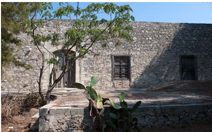
Εικ. 10. Η έπαυλη του Σίγκερ στην Παχειά Άμμο Ιεράπετρας.

Οι Καρπάθιοι, όμως, δεν οικοδομούσαν και δεν επισκεύαζαν μόνο χριστιανικούς ναούς. Σε έναν μάστορα από το Απέρι, τον Ιωάννη Καφερτζιδόπουλο, ανατέθηκε το 1885 η οικοδόμηση μουσουλμανικού τζαμιού στα Δαμάνια Μονοφασίου. Το σχετικό έγγραφο, που δημοσιεύτηκε επίσης από τον Μ. Δρακάκη (2016, 97), αναφέρει και την αμοιβή του: 4,5 γρόσια ο κτιστικός πήχυς.