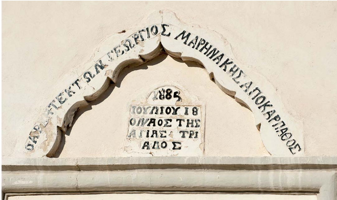
Εικ. 5. Η επιγραφή στον ναό του Αγίου Γεωργίου και της Αγίας Τριάδος στις Κορφές Μαλεβιζίου πριν την απόξέσή της (2011).

Το Εκκλησιαστικό Συμβούλιο και η Κοινότητα Ζαρού τον ευχαρίστησαν και τον επαίνεσαν δημοσίως για την «άρχιτεκτονική του τέχνην και τήν ακριβή τήρησιν τῆς μετρίας συμφωνίας ἐπὶ τῆς οἰκοδομῆς τοῦ ναοῦ τοῦ Ἁγίου Γεωργίου, συγκεκριμένου ἐκ δύο θόλων καὶ ἐξ ἑνὸς κωδωνοστασίου εἰς τὸ ὁποῖον χωροῦν τρεῖς κώδωνες» (Δρακάκης 2016, 93).