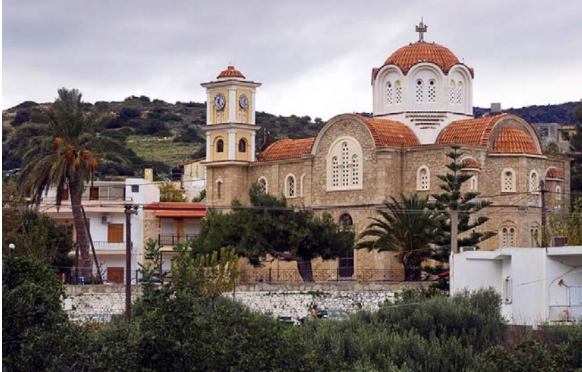
Εικ. 9. Ο ναός της Εφτάτρουλης στην Επισκοπή Ιεράπετρας.

Ο ναός της Εφτάτρουλης δεν ολοκληρώθηκε κατά την εποχή που περιγράφει ο Στρατάκης, αλλά πολλές δεκαετίες αργότερα. Ακόμη και μια απλή αυτοψία στον χώρο καταδεικνύει τη διαφορά στο χτίσιμο (Εικ. 9).