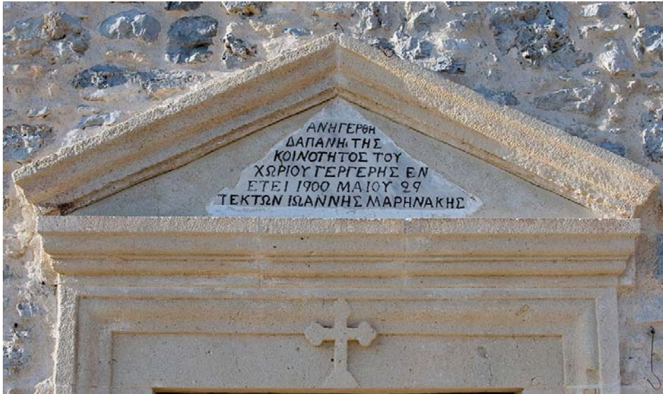
Εικ. 8. Η επιγραφή στον ναό του Αγίου Ιωάννη στη Γέργερη.