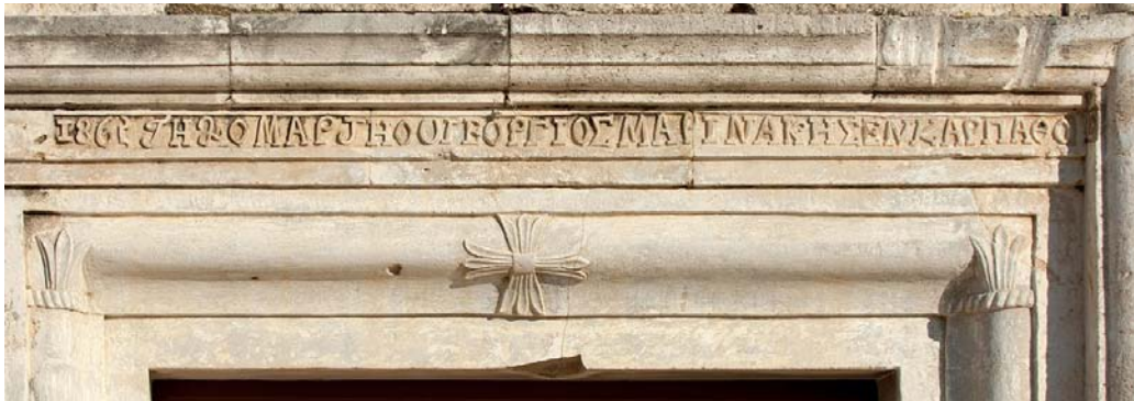
Εικ. 3. Η επιγραφή στον ναό του Αγίου Πνεύματος στο Πετροκεφάλι Μεσαράς.

αλλά και όπως επιβεβαιώνουν οι αρχαιακές πηγές. 17 Πιθανότατα είναι δικό τους έργο και το πυργόσχημο κωδωνοστάσιο του καθεδρικού ναού του Αγίου Μύρωνα (Εικ. 1), με τόξα και εξώστη, εμφανώς επηρεασμένο από δυτικά πρότυπα. 18 Το επίσης πυργόσχημο μνημειακό ρολόι του χωριού, αφιέρωμα ομογενή από τις Ηνωμένες Πολιτείες, χτίστηκε από τον Φίλιππο Γιαννόπουλο κατά τις πρώτες δεκαετίες του 20ού αιώνα. Ένας άλλος χτίστης, ο Νικόλαος Βιττώρης από τις Μενετές, επισκευάζει τον ναό της Παναγίας στο Κεραμούτσι, στη θέση Γρομπόλα, στο σώχωρο του Μουσουλμάνου Αμπτίν Βέη Μουτεβελάκη (Εικ. 2). Ο ναός αυτός ήταν αρχικά μονόχωρος και τοιχογραφημένος. Τον 16ο αιώνα ανακαινίστηκε και από μονόχωρος μετατράπηκε σε ελεύθερο σταυρό με τρούλο (Μυλοποταμιτάκη 1998, 133). Κατά τον 19ο αιώνα είχε υποστεί σοβαρές ζημιές, ίσως και να είχαν καταστραφεί οι δύο κεραιές του σταυρού, η βόρεια και η νότια. Γι' αυτό αναφέρεται στη σχετική σύμβαση ότι «η εκκλησία θα επεκτεινόταν και στις δυο της πλευρές» (Δρακάκης 2016, 96).