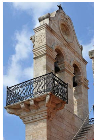
Εικ. 1. Το κωδωνοστάσιο του ναού του Αγίου Μύρωνα Μαλεβιζίου.

Οι Καρπαθιώτες της Πυργούς αναλαμβάνουν εργασίες σε όλα σχεδόν τα χωριά του Μαλεβιζίου, όπως δείχνουν και οι επιγραφικές μαρτυρίες, όπως διασώζει η τοπική παράδοση,