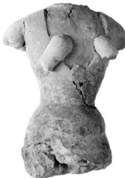
Εικ. 13. Υπαίθριο ιερό Πισκοκεφάλου Σητείας, τμήμα γυναικείου ειδωλίου με «χειρονομία αποκάλυψης» του στήθους: Πλάτων (2014), εικ. 4.

σπάσιμο παρθενικού υμένα κατά τον γάμο, τοκετός. Ίσως, το ξεκίνημα της εμμήνου ρύσεως να αφορά την όρθια, ντυμένη με κροκωτό, διάφανο πέπλο κοπέλα (ένα ένδυμα μήσης; ένα γαμήλιο πέπλο;) Η κοπέλα κινείται ρυθμικά μακριά από το ιερό που περικλείει ελιά και ενδεχομένως υπονοεί βωμό προορισμένο για αιματηρές σπονδές ή θυσίες. Μήπως λοιπόν κοιτάζει πίσω προς τον εσωτερικό χώρο που φιλοξένησε το τελετουργικό της μήσης της καθώς εισέρχεται στην εφηβική και κατόπιν ενήλικη ζωή (Koraka 2009, 189); Ακολούθως, η μεσαία, τραυματισμένη κοπέλα, με την έκφραση πόνου στο πρόσωπό της μήπως συνδέεται με την πρώτη σεξουαλική επαφή και την εγκυμοσύνη; Έπειτα, το απεικονιζόμενο κτήριο αφορά πράγματι ένα «δωμάτιο γυναικών» για απομόνωση, κατά το πρότυπο της καλύβας που γνωρίζουμε από ανθρωπολογικά παραδείγματα ότι προορίζεται για την απομόνωση των κοριτσιών κατά τη μήσή τους στη γυναικεία ωρίμανση; Ή μήπως αποτελεί ένα «δωμάτιο τοκετού», όπως αυτά που συναντάμε στην Αίγυπτο (Koraka 2009, 191); Τότε, η τρίτη όρθια στα αριστερά κοπέλα με το περιδέριο στο χέρι μήπως συμβολίζει το επόμενο στάδιο, την επιτυχή είσοδό της στην ακμή της γυναικείας παραγωγικότητας, δηλαδή τη μητρότητα; Το περιδέριο είναι ένα δώρο μήσης για την επιτυχή είσοδό της στην ενηλικίωση; Το πλήρως ανεπτυγμένο και προβεβλημένο στήθος της είναι έτοιμο να θηλάσει;