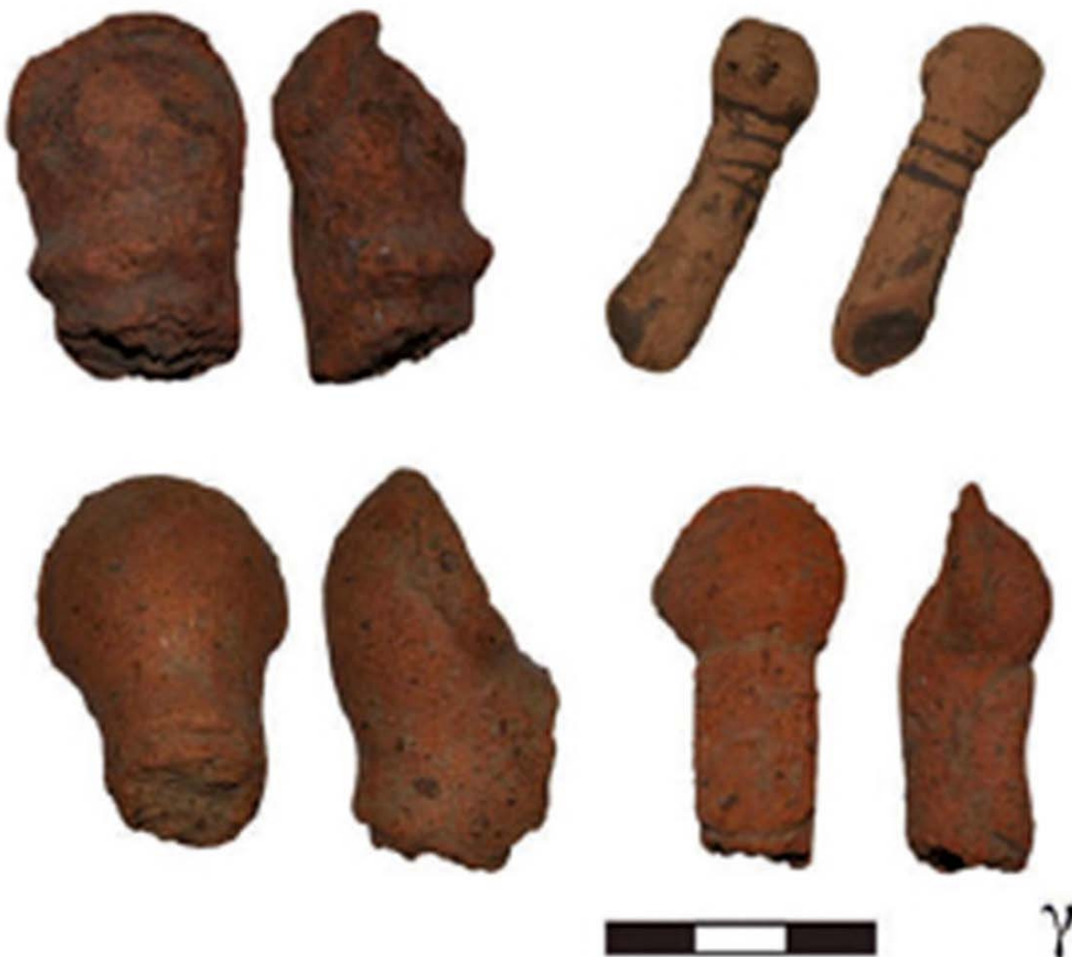
Εικ. 10. Ιερό κορυφής Κόφινα, πήλινα γάντια πυγμάχων: Σπηλιωτοπούλου (2015), εικ. 3γ.

καταδρομής με σκηνές εφόδου, καταδίωξης και φυγής. Κάποιοι μελετητές μάλιστα διακρίνουν σε αυτές εκπαιδευτές και μαθητευόμενους (Säflund 1987, 230-231), παραπέμποντας στο μνητικό χαρακτήρα αυτών των δραστηριοτήτων. Η εικονογράφηση πυγμάχων δεν είναι άγνωστη στην αιγαιακή εικονογραφία, με διασημότερο το παράδειγμα της τοιχογραφίας των μικρών αγοριών από το Κτήριο Β του Ακρωτηρίου. Υπάρχουν όμως και τρισδιάστατες απεικονίσεις πυγμάχων, όπως το πήλινο ανδρικό ειδώλιο του Βρετανικού Μουσείου, με οξύληκτο πύλο και σωζόμενο χέρι με γάντι πυγμαχίας, 6 καθώς και οι πυγμάχοι από το ιερό κορυφής του Κόφινα Αστερουσίων (Σπηλιωτοπούλου 2015, 289-290, Σπηλιωτοπούλου 2016) (Εικ. 9, 10). Η ανάγκη για εξειδίκευση