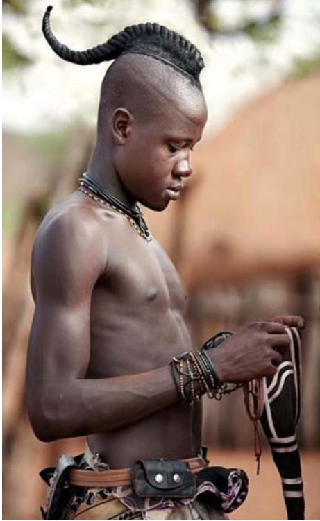
Εικ. 2. Namibia, νεαρός Himba με τη χαρακτηριστική κόμμωση ondatu.