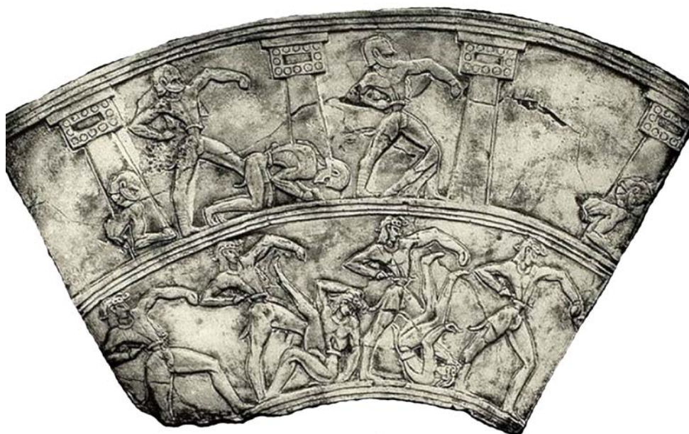
Εικ. 8. Έπαυλη Αγίας Τριάδας, «Αγγείο Αγωνισμάτων», ανάπτυγμα χαμηλότερων ζωνών: Evans, PM IV.1 , εικ. 10.

Στο Αγγείο των Αγωνισμάτων ( Boxer's Vase ) παρακολουθούμε ζώνες ομαδικών αγωνισμάτων που ίσως ανταποκρίνονται σε διαφορετικές ηλικιακές βαθμίδες (Εικ. 8): πάλη με γυμνά χέρια και πόδια, πυγμαχία με κράνη και γάντια, ταυροκαθάψια, πάλη που έχει τον χαρακτήρα