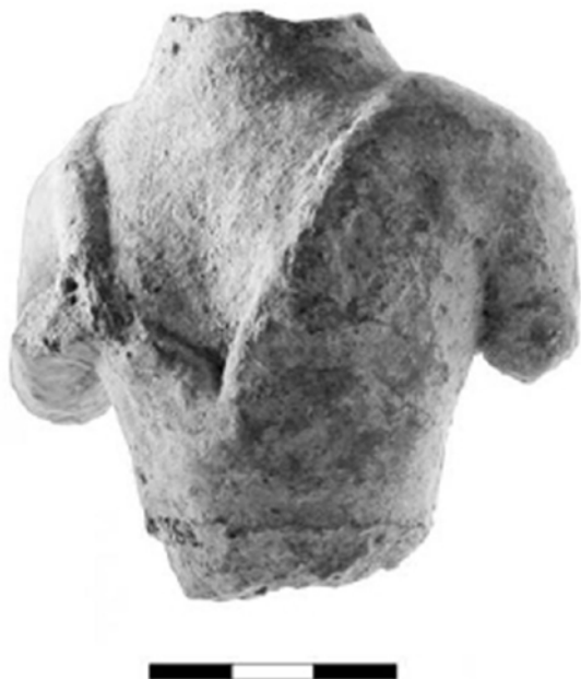
Εικ. 12. Υπαίθριο ιερό Πισκοκεφάλου Σητείας, τμήμα γυναικείου ειδωλίου με «χειρονομία αποκάλυψης» του στήθους: Πλάτων (2014), εικ. 3.