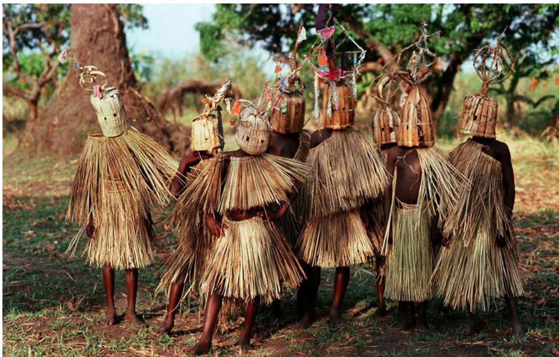
Εικ. 1. Φυλή Yao, Malawi: αγόρια 9-10 χρονών σε τελετή μύησης.

του όρου παιδί ή νέος ποικίλλουν ιστορικά, αλλά και σε συμβολικό-τελετουργικό επίπεδο (Van Gennep 1960, Warner 1959, 303). 2