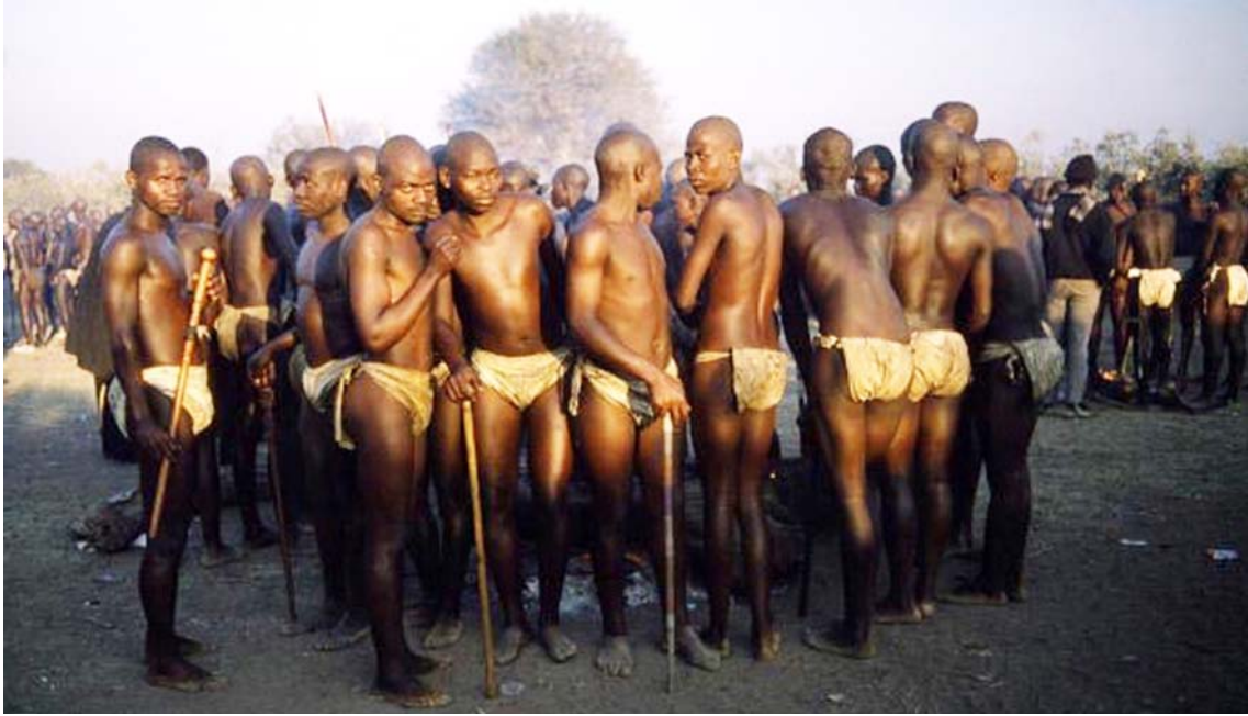
Εικ. 4. Ν. Αφρική, νέοι της φυλής Ndebele μουούνται στο κυνήγι.

την υιοθέτηση ενός εξιδανικευμένου ανδρικού ρόλου, ο οποίος αντιδιαστέλλεται προς ό,τι θεωρείται γυναικείο. Γι' αυτό τον λόγο σε ορισμένες παραδοσιακές κοινωνίες οι άνδρες αντισταθμίζουν την έλλειψη αντίστοιχων διαδικασιών με τελετουργίες που συμβολίζουν τις βιολογικές λειτουργίες του γυναικείου οργανισμού για να σημειώσουν το πέρασμα από την παιδικότητα στην ενηλικίωση (ροή αίματος, μίμηση εγκυμοσύνης ή τοκετού κ.ά.) (Κοκκινίδου – Νικολαΐδου 1993, 36-37).