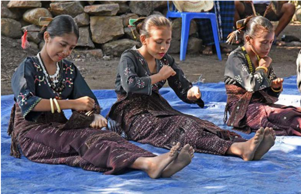
Εικ. 5. Ινδονησία, A Flores, χωριό Bama. Αναπαράσταση βαφής, γνεσίματος, υφαντικής.

στις ανταλλακτικές σχέσεις καθώς τον καλεί να ανταποκριθεί στις συνεχείς ανταλλαγές τροφής όχι μόνο με τους οικείους του αλλά και τη μελλοντική σύζυγό του και τους συγγενείς της, έτσι τον βοηθά να ενηλικιωθεί σε κοινωνικά αναγνωρισμένο ενήλικα (Elliston 2006, 200-201).