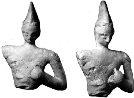
Εικ. 9. Βρετανικό Μουσείο, πήλινο ειδώλιο πυγμάχου: Rethemiotakis (2014), φωτ. 6.

καταδρομής με σκηνές εφόδου, καταδίωξης και φυγής. Κάποιοι μελετητές μάλιστα διακρίνουν σε αυτές εκπαιδευτές και μαθητευόμενους (Säflund 1987, 230-231), παραπέμποντας στο μνητικό χαρακτήρα αυτών των δραστηριοτήτων. Η εικονογράφηση πυγμάχων δεν είναι άγνωστη στην αιγαιακή εικονογραφία, με διασημότερο το παράδειγμα της τοιχογραφίας των μικρών αγοριών από το Κτήριο Β του Ακρωτηρίου. Υπάρχουν όμως και τρισδιάστατες απεικονίσεις πυγμάχων, όπως το πήλινο ανδρικό ειδώλιο του Βρετανικού Μουσείου, με οξύληκτο πύλο και σωζόμενο χέρι με γάντι πυγμαχίας, 6 καθώς και οι πυγμάχοι από το ιερό κορυφής του Κόφινα Αστερουσίων (Σπηλιωτοπούλου 2015, 289-290, Σπηλιωτοπούλου 2016) (Εικ. 9, 10). Η ανάγκη για εξειδίκευση