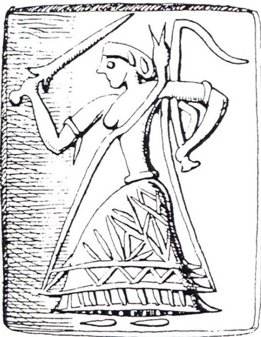
Εικ. 7. Κνωσός, σφραγίδα με «μαστιγοφόρο», Νεοανακτορική περίοδος: Evans, PM II , εικ. 517.

διαφορές ηλικίας και κοινωνικής θέσης τονίζονται μέσω της κόμμωσης, της ένδυσης και των εξαρτημάτων τους (Koehl 1986, Säflund 1987). Ο νεαρότερος άνδρας στα αριστερά ερμηνεύεται ως βουαγός που ηγείται ομάδας νέων και λαμβάνει εντολές από άλλο άνδρα ήδη προηγμένο από την αγέλη. Αν πράγματι είναι μαστίγιο το αντικείμενο με κυρτή απόληξη που κρατά ο νεαρότερος άνδρας, θα μπορούσε να παραπέμπει σε πρακτικές ανάλογες με την τελετουργική διαμασίγωση των νέων στο