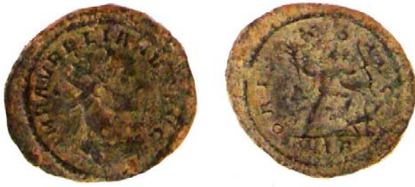
Εικ.7. N. 60: Billon Αντωνινιάνος Αυρηλιανού. Τάφος Β5. Αρχαίος δρόμος. 24-5-2002.

Ήλιου εικονίζεται ένας γονατιστός αιχμάλωτος, στοιχείο που αποτελεί ένδειξη κάποιας αυτοκρατορικής νίκης.