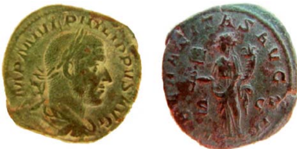
Εικ. 5. N. 89: Σηστέρτιος Φιλίππου Άραβος. Μάρτυρας Α3-Α4 (γωνία τοίχ. 5-10). 16-08-2002.