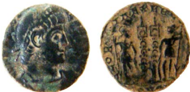
Εικ. 17. N. 113: Φόλλις 4ου αι. μ.Χ. Τάφος Γ3. Δάπεδο 1. 26-9-2002.

N. 73 (Εικ. 18): Φόλλις ή Nummus. 0,016 m.