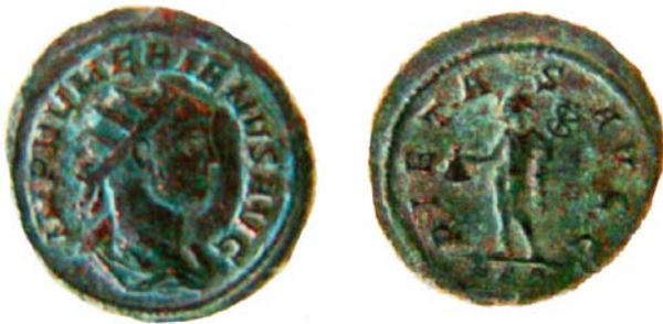
Εικ. 8. N. 197: Billon Αντωνινιάνος Νουμεριανού. Τάφος Ζ5. Δάπεδο 3. 22-7-2003.

Οπ.: Pietas. Ιστάμενη μορφή με βαλάντιο (πουγκί) και κηρύκειο. PIETAS AVGG KAA RIC Vb, σ. 195, αρ. 413, πίν. VIII, αρ. 8.