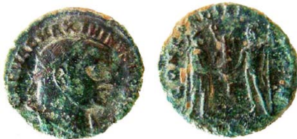
Εικ. 9. Ν. 4: Ακτινωτή υποδιαίρεση Μαξιμίνου Β΄. Τάφος Α. Ομ. 3. 20-4-2001.