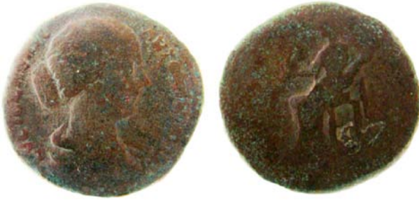
Εικ. 4. N. 268: Σηστέρτιος Λουκίλλας. Καθαρισμός τοίχ. 24. 10-5-2006.

N. 268 (Εικ. 4): Σηστέρτιος. 0,031 m. Αξ. 6. 164-169 μ.Χ.