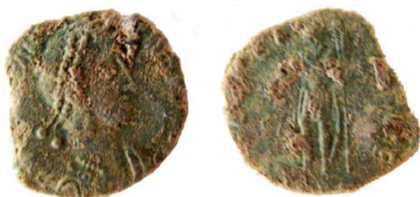
Εικ. 19. N. 70: Φόλλις 4ου αι. μ.Χ. Τάφος Β4 Ομ. 3 (βόρεια τοιχ. 9). 3-6-2002.

Πρβλ. RIC VIII, σ. 168, αρ. 361, σ. 192, αρ. 201, σ. 499, πίν. 25, αρ. 118.