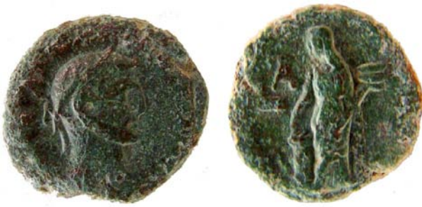
Εικ. 10. N. 141: Billon τετράδραχμο Διοκλητιανού στην Αλεξάνδρεια. Τάφος Δ5. Ομ. 2. 28-2-2003.