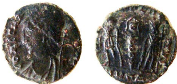
Εικ. 15. Ν. 42: Ομοίως. Τάφος Α2. Ομ. 4. 17-4-2002.