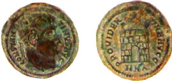
Εικ. 11. N. 138: Φόλλις Μ. Κωνσταντίνου. Μάρτυρας Α1-Α2. 6Κ. 20-11-2002.

N. 138 (Εικ. 11). Φόλλις ή Nummus. 0,017 m. Νομισματοκοπείο Νικομήδειας. ΜΝΑ. Εμπρ.: Δαφνοστεφής κεφαλή Μ. Κωνσταντίνου. Προς τα δεξιά, CONSTANTINUS AUG. Οπ.: Πύλη στρατοπέδου (campgate). PROVIDENTIA AUGG. (Στον οπισθότυπο αυτό υποδηλώνεται η πρόνοια του αυτοκράτορα για τις οχυρώσεις και την άμυνα.) Πρβλ. RIC VII, σ. 620, αρ. 121, πίν. 22, αρ. 56-60.