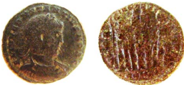
Εικ. 16. Ν. 48: Φόλλις Κωνσταντίου Β΄. Περिसυλλογή.

Ν. 48 (Εικ. 16). Φόλλις. Νομισματοκοπείο Κωνσταντινούπολης; Εμπρ.: Προτομή Κωνσταντίου Β΄ ως Καίσαρα, με διάδημα. Προς τα δεξιά, FL (avius) IUL (ius) CONSTANTIUS NOB (ilis) C (aesar). Οπ.: Gloria Exercitus. Όπως εικ. 12. Πρβλ. RIC VII, σ. 579, αρ. 61, πίν. 22, αρ. 70.