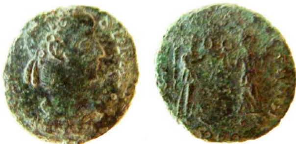
Εικ. 20. Ν. 114: Φόλλης 4ου αι. μ.Χ. Μάρτυρας Α1-Α2. Ομ.3. 18-10-2002.

Ακολουθεί ένας άλλος νομισματικός τύπος που εξυμνεί τις Νίκες των αυτοκρατόρων: