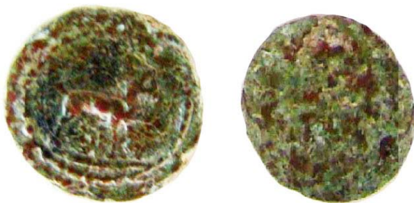
Εικ. 3. N. 110: Χάλκινο νόμισμα, πιθανόν Κοινού Κρητών. Τάφος Α3. Δοκιμαστική τομή 1. Αφαίρεση δαπέδου 2. 12-9-2002.