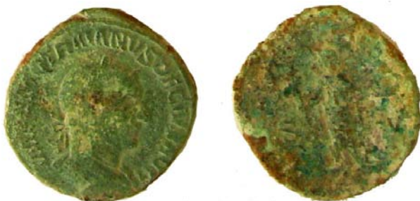
Εικ. 6. N. 243: Σηστέρτιος Τραϊανού Δεκίου. Τάφος Ε1. Καθαρισμός 6Κ. 29-7-2004.