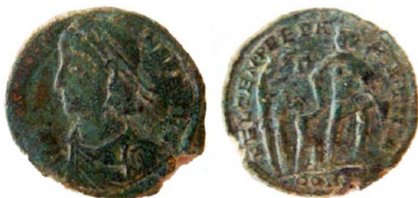
Εικ. 18. N. 73: Φόλλις Κώνσταντος. Τάφος Β4. Ομ.4. Δάπεδο 1 (βόρ. Τοίχ. 9). 7-6-2002.

Πρβλ. RIC VIII, σ. 453-454, πίν. 22, αρ. 92.