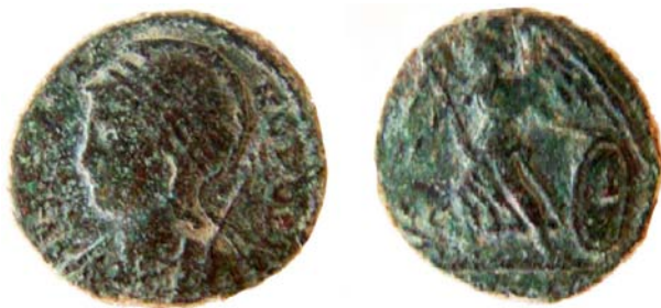
Εικ. 13. N. 102: Επετειακή χάλκινη κοπή (φόλλις) Μ. Κωνσταντίνου. Τάφος Β3. 2-9-2002.

N. 102 (Εικ. 13): Φόλλις. 0,015 m. Επετειακή κοπή για την ίδρυση της Κωνσταντινούπολης από τον Μ. Κωνσταντίνο. 330-331 μ.Χ.