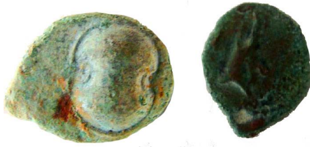
Εικ. 1. N. 236: Χάλκινο νόμισμα της Πολυρρήνιας. Τάφος Δ2. Ομ. 4. 14-06-2004.