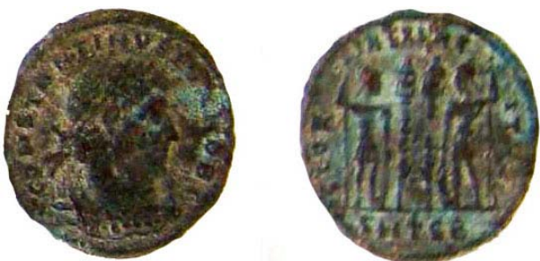
Εικ. 21-23. 3 χάλκινα νομίσματα (φόλλεις) από τον θησαυρό. Τάφος Ζ5. Ομ. 3. 25-6-2003.

Ακολουθούν 2 ακόμα φόλλεις, 20 που φέρουν τις ίδιες παραστάσεις: