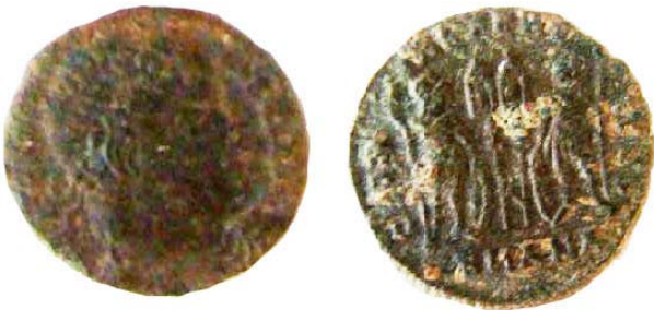
Εικ. 12. N. 129: Φόλλις Μ. Κωνσταντίνου. Τάφος Β2. Δάπεδο 1. 30-10-2002.

N. 129 (Εικ. 12): Φόλλις. 0,017 m. Νομισματοκοπείο Αντιόχειας. SMANA Εμπρ.: Κεφαλή Μ. Κωνσταντίνου προς τα δεξιά. Οπ.: Gloria Exercitus. Δύο στρατιώτες πλαισιώνουν λάβαρο. (Υποδηλώνεται έτσι η στρατιωτική ακμή της αυτοκρατορίας.) Πρβλ. RIC VII, σ. 693, αρ. 86-90, πίν. 22, αρ. 70.