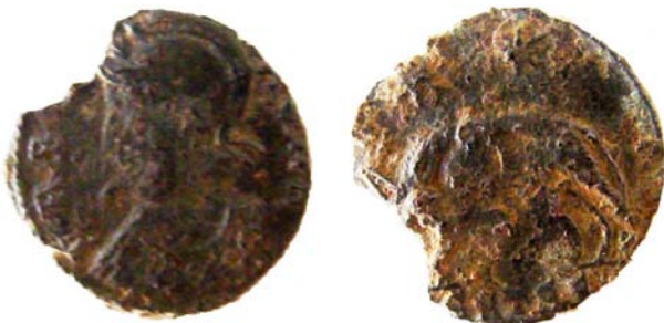
Εικ. 14. N. 130: Ομοίως. Τάφος Β2. Δάπεδο 1. 30-10-2002.