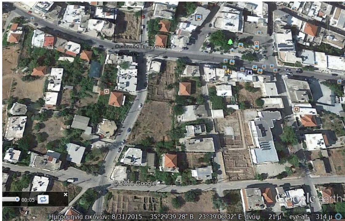
Κάτοψη 2. Πανοραμική όψη του οικοπέδου Γεωργακάκη-Σκουνάκη από το Google Earth. Χαρακτηριστικό είναι το γεγονός ότι το συγκεκριμένο οικόπεδο βρισκόταν στη συμβολή δύο κεντρικών οδών από την αρχαιότητα μέχρι σήμερα.

Οι ανασκαφές στην Κίσαμο μέχρι σήμερα έφεραν στο φως σπουδαία οικιστικά και ταφικά σύνολα (Μαρκουλάκη 2009, 337 κ.ε.). 1