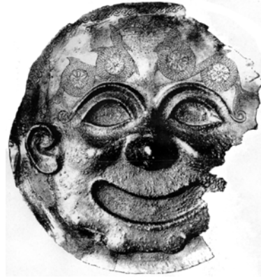
Εικ. 7. Το χάλκινο γοργόνειο (Marinatos 1936, πίν. XXIX).

δεν χρησιμοποιείται σε ανάγλυφα του ελληνικού χώρου. Το χρώμα παραπέμπει σε νεο-χεττιτικές και νεο-ασσυριακές στήλες από βασάλτη, οι οποίες διακοσμούσαν τους τοίχους των ανακτόρων της Ανατολής. Μοναδική επίσης είναι η τεχνική της. Πρώτα χάραξαν τα περιγράμματα και στη συνέχεια επεξεργάστηκαν όλη την επιφάνεια με το βελόνι, αναδεικνύοντας σε πολύ χαμηλό ανάγλυφο τις μορφές. Ως μέθοδο για την κατανόσή της επιλέξαμε να ερευνήσουμε τη σχέση της με τον χώρο και τα άλλα ευρήματα που σχετίζονται με αυτήν.