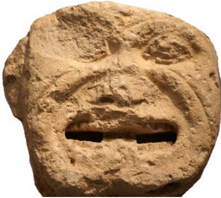
Εικ. 6. Το πώρινο γοργόνειο.