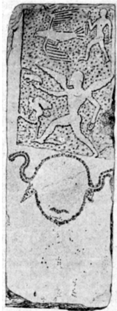
Εικ. 5. Το πρώτο σχέδιο της στήλης (Demargne 1933).

σε γωνία, έναν δακτύλιο. Σε μικρότερη κλίμακα μπροστά στη μορφή εικονίζεται μια φτερωτή σφίγγα πάνω σε μια κεκλιμένη επιφάνεια που μοιάζει με βωμό. Τέλος στη χαμηλότερη ζώνη της στήλης, επάνω σε μη επεξεργασμένη επιφάνεια, είναι χαραγμένο το περίγραμμα ενός γοργονείου, από το οποίο αποτυπώνεται μόνο το στόμα, δύο φίδια στα πλάγια και το αριστερό αυτί.