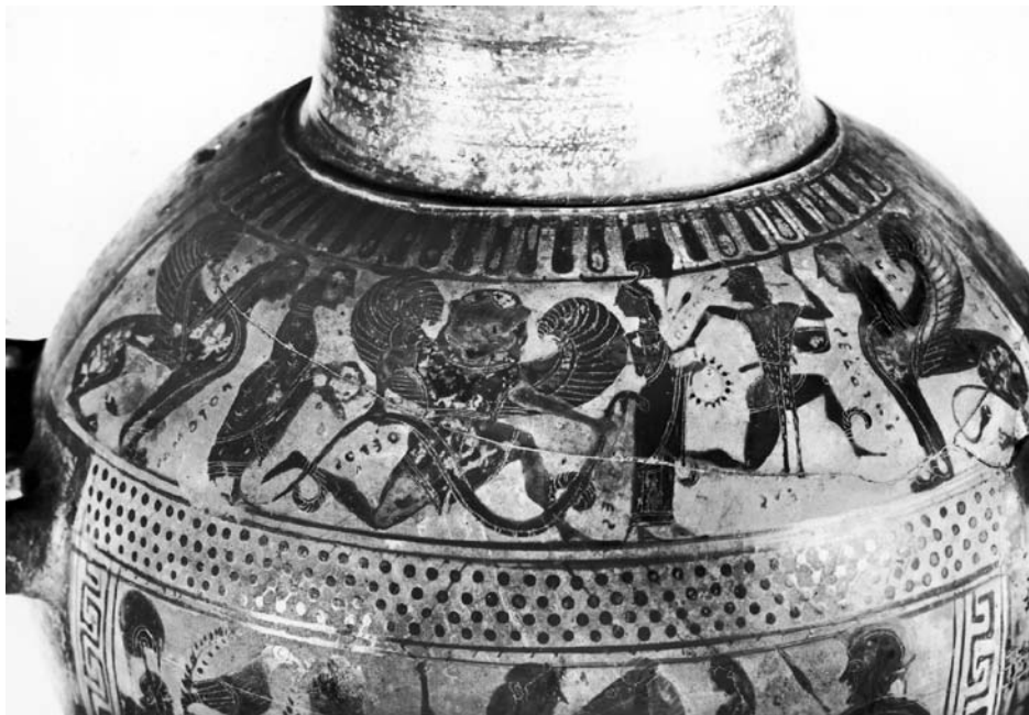
Εικ. 11. Λεπτομέρεια μελανόμορφης υδρίας με παράσταση Περσέα.

Σε ένα ετρουσκικό κύπελλο από τη Νόλα (Cook 1965, 720· Krauskorf 1986, 95-101) βλέπουμε τον Περσέα που καταδιώκεται από τις γοργόνες ανάμεσα σε δύο κίονες που στέφονται από σφίγγες (Εικ. 10). Επίσης σε μια υδρία μελανόμορφου ρυθμού του 560-550 π.Χ. από το Kunsthistorische