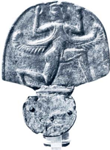
Εικ. 12. Χάλκινη λαβή με φτερωτή μορφή.

Museum στη Βιέννη (Εικ. 11) ο Περσέας και η Ανδρομέδα πλαισιώνονται από μια ολόσωμη Μέδουσα και μια φτερωτή σφίγγα (Jameson 2014, 36).