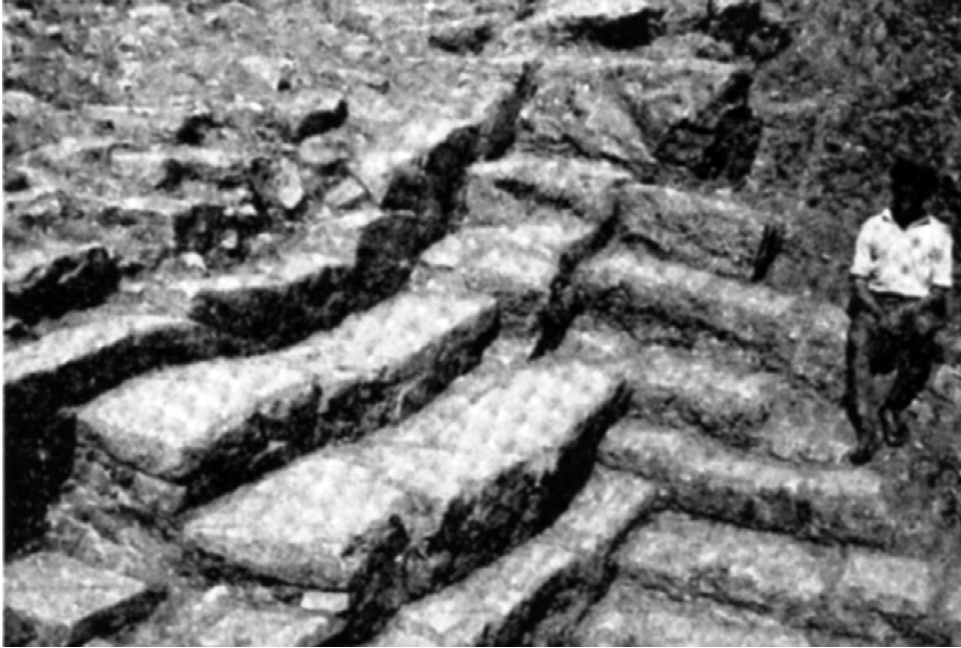
Εικ. 3. Η νοτιοδυτική γωνία της κλίμακας της αγοράς (Demargne 1937).