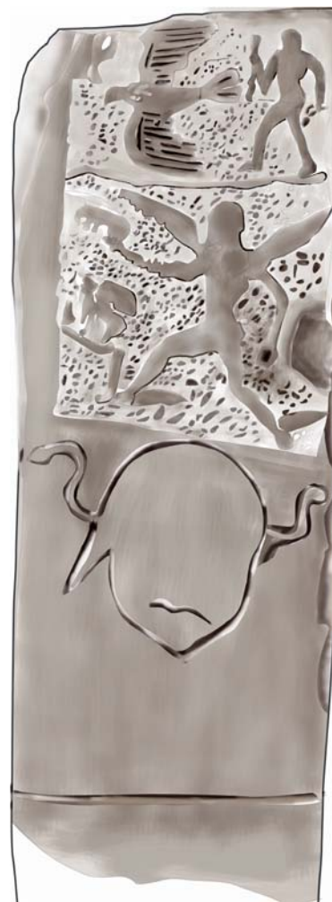
Εικ. 8. Νέο σχέδιο της στήλης (Πέπη Στεφανάκη, σχεδιάστρια ΑΜΗ).

Σε κάθε περίπτωση το παλλάδιο αντιπροσωπεύει ένα ανάθημα, που έχει συμβολικό χαρακτήρα: ανατίθεται πιθανότατα σε μια θεότητα ανάλογου χαρακτήρα για την προστασία μιας συγκεκριμένης τάξης οπλιτών. Από την ίδια τάξη είναι φυσικό να προέρχονται και οι δύο χάλκινες μίτρες, το τμήμα χάλκινου κράνους και τα μικρογραφικά ελάσματα ασπίδων, μιτρών, θωράκων, κνημίδων και κρανών που βρέθηκαν στον ναό που ανέσκαψε ο Ξανθουδίδης στον δυτικό λόφο της πόλης (Ξανθουδίδης 1918, 27-28). Ο ναός αυτός του δυτικού λόφου συνδέθηκε από τον D'Acunto με ναό αφιερωμένο στην Αθηνά Πολιούχο (Acunto 2002-2003, 57). Κοντά στον ναό αυτό βρέθηκε