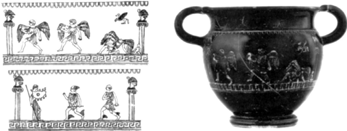
Εικ. 10. Ετρουσκικό κύπελλο με παράσταση Περσέα (Irene Krauskorf 1986).

θα πρέπει να υποθέσουμε ότι η στήλη αποτελούσε μέρος μιας σειράς στηλών που έχει χαθεί. Το αριστερό χέρι της μορφής θα μπορούσε να κρατά απλώς μια πέτρα για να σκοτώσει τον δράκο, παρόμοια με αυτή της εικόνας που παραθέτουμε (Εικ. 9). Με το σκεπτικό μας ότι το γοργόνειο που εικονίζει είναι σύγχρονο με την υπόλοιπη παράσταση, αν και πιθανότατα μισοτελειωμένο, και όχι μεταγενέστερο κατά εκατό χρόνια, όπως υποστήριξε ο Μαρινάτος, η μόνη μορφή που σχετίζεται με την πτερωτή μορφή είναι ο Περσέας.