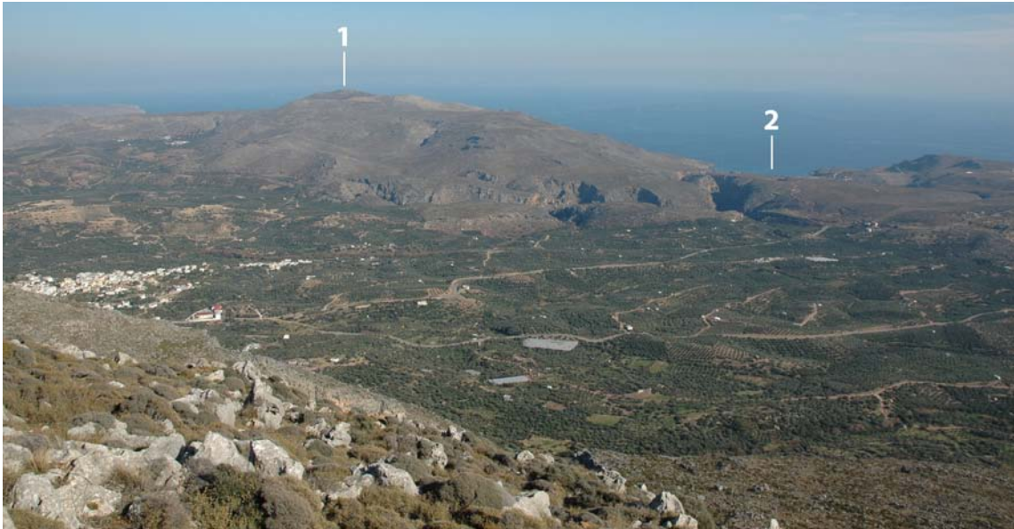
Εικ. 1. Ο ορεινός όγκος του Τραόσταλου και η λοφώδης ζώνη της Πάνω Ζάκρου. Όπου 1: το ιερό κορυφής· 2: ο όρμος της Κάτω Ζάκρου. Από Δ/ΝΔ.

και της Κάτω Ζάκρου – δύο σημαντικοί σταθμοί για τη ναυσιπλοΐα της Εποχής του Χαλκού (Πλάτων 1974, 228· Chryssoulaki 2005, 83-85). Προς τα δυτικά και μέχρι τον συμπαγή όγκο των Σητειακών βουνών εκτείνεται το μεσόγειο βύθισμα της Πάνω Ζάκρου. Αυτή η λοφώδης ζώνη είναι η πλέον εύφορη της ευρύτερης περιοχής. Ο ίδιος ο Τραόσταλος είναι πάντως άγονος: τα πλατώματά του είναι σήμερα γυμνά και προσφέρονται μόνο για την κτηνοτροφία. Η κορυφή του εποπτεύει όλο το ανατολικό άκρο της Κρήτης, όπως και το πέλαγος από το Κουφονήσι μέχρι την Κάρπαθο. Διακρίνονται όλα τα ιερά κορυφής της ευρύτερης περιοχής, όχι όμως η μινωική πόλη της Κάτω Ζάκρου – το κέντρο με το οποίο συνδεόταν η θέση.