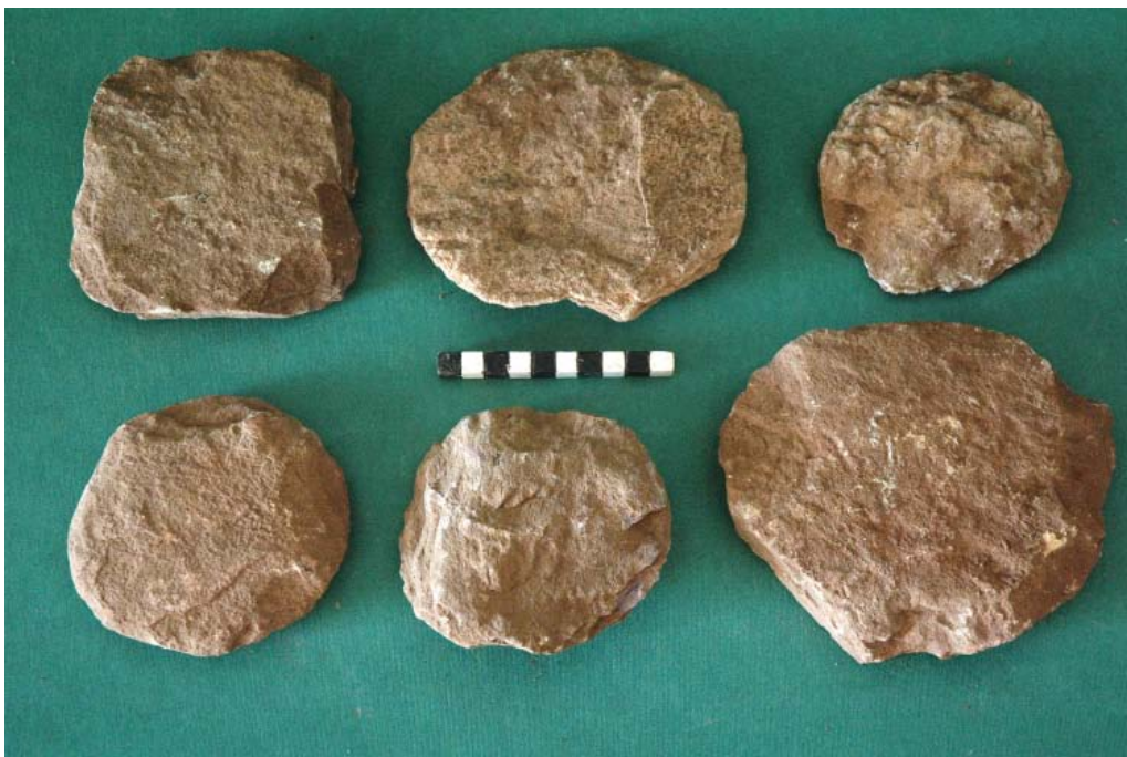
Εικ. 8. Τραόσταλος: Λίθινοι δίσκοι.

Πάνω τους πρέπει να τοποθετούνταν μικρές ποσότητες δημητριακών ή άλλων καρπών με ιδιαίτερο συμβολικό βάρος και πρωταρχική σημασία για την αγροτική οικονομία. Οι προσφορές αυτές θα αποτελούσαν το αντίστοιχο των μεταγενέστερων απαρχών (Chryssoulaki 2001, 62).