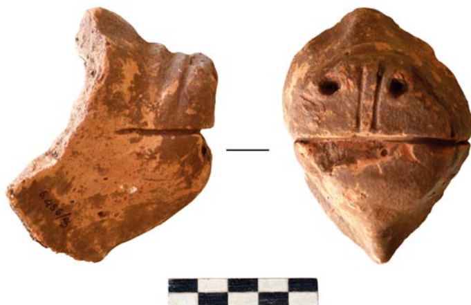
Εικ. 6. Τραόσταλος: Κεφαλή ειδωλίου σκύλου.