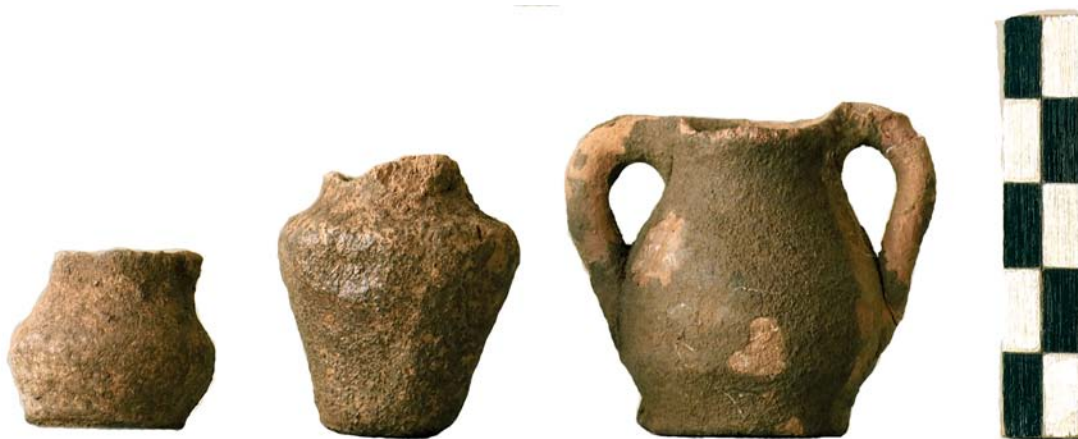
Εικ. 7. Τραόσταλος: Μικκύλα αγγεία.

προσαρτημένες σε αγγεία και ομοιώματα τοπίων ή κατασκευών – μεταξύ αυτών ένα ιδιαίτερα εκφραστικά αποδοσμένο ψάρι (Χρυσουλάκη 1995, πίν. 233δ). Αρκετά είναι τα ομοιώματα ανθρώπινων μελών με σπή ανάρτησης, που τεκμηριώνουν μια ιαματική διάσταση της λατρείας (Chryssoulaki 2001, 62). Βρέθηκαν επίσης πήλινα σφαιρίδια, μικρογραφικό υπόδημα και τεμάχια από ομοιώματα κτηρίων και λέμβου. Τα εξαρτήματα της ένδυσης περιορίζονται σε δύο χάλκινες περόνες· στην ίδια κατηγορία ανήκουν ίσως και τα χρυσά ελάσματα από την παλαιότερη ανασκαφή (βλ. Αλεξίου 1964β, 442). Τέλος άφθονα ήταν τα μικκύλα αγγεία. Στην πλειονότητά τους αναπαριστούν πίθους και αμφορείς (Εικ. 7).