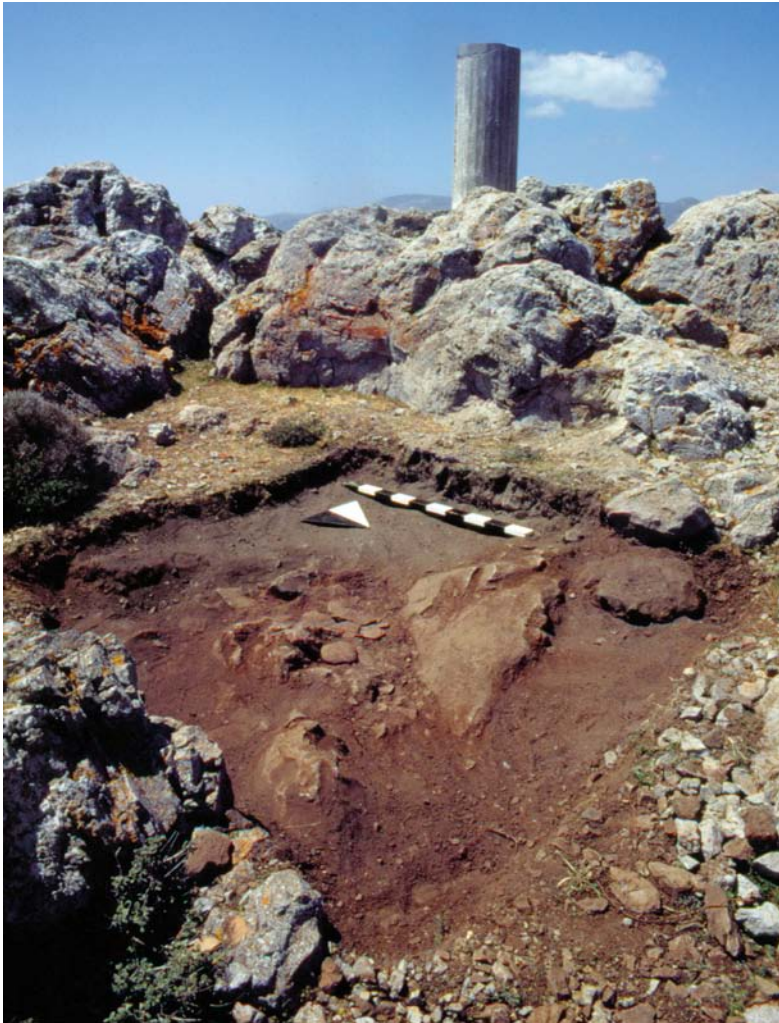
Εικ. 5. Εσοχή στα ανατολικά του βράχου της κορυφής: Το στρώμα της στάχτης κατά τη διάρκεια της ανασκαφής του και στο μέσον η απαρχή της συγκέντρωσης των λίθινων δίσκων. Από ΒΑ.

Πολύ πιο σύνθετη ήταν η στρωματογραφία στον πυρήνα του ιερού. Στην προστατευμένη εσοχή, η οποία διαμορφώνεται ανάμεσα στον βράχο της κορυφής και τις πλευρικές προεκτάσεις του, εκτεινόταν στρώμα στάχτης που περιείχε κεραμική Μινωικών αλλά και Ενετικών χρόνων (Εικ. 5). Ακολουθούσε ένα πολύ λεπτό στρώμα, συσσωρευμένο μάλλον από την αιολική διάβρωση, που δεν έδωσε παρά μερικά φθαρμένα μινωικά όστρακα. Κάτω του εκτεινόταν μεγάλος αριθμός λίθινων δίσκων. Οι δίσκοι απαντούσαν ενίοτε σε στρώσεις, όμως στην πλειονότητά τους ορίζανε ένα ενιαίο επίπεδο – ήταν δηλαδή σε χρήση ταυτοχρόνως (βλ. Χρυσουλάκη 1995, πίν. 233β· της ίδιας 1999, 312 εικ. 12). Οι επιχώσεις ανάμεσά τους –όπως και εκείνες του υποκείμενου στρώματος– ήταν σκούρες και λιπαρές, πιθανώς λόγω του συστηματικού εμποτισμού τους με υγρές προσφορές. Το κατώτερο στρώμα έδωσε πυριτόλιθους, οστά και νεολιθική κεραμική. Διαφορετική ήταν η εικόνα στην περιοχή αμέσως ανατολικά της εσοχής: σε αντίθεση με το στρώμα των δίσκων, που απέδωσε ελάχιστα όστρακα, εκεί εντοπίστηκε μεγάλη συγκέντρωση κεραμικής. Βρέθηκαν επίσης πολλά τεμάχια λίθινων αγγείων και ζωόμορφων ρυτών, ενώ οι δίσκοι ήταν ελάχιστοι.