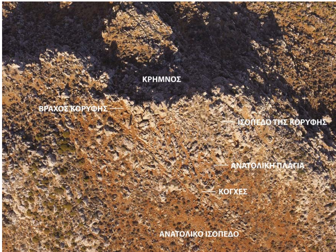
Εικ. 3. Τραόσταλος: Η περιοχή του ιερού. Άποψη από αέρος.

ομαλές· αντίθετα, η δεύτερη ορίζεται στα δυτικά από κρημνώδη κατωφέρεια. Το ιερό αναπτύχθηκε στην τελευταία, πιθανότατα επειδή ο κρημνός θεωρείτο το όριο μεταξύ του επίγειου και του επουράνιου κόσμου (βλ. Βοκοτόπουλος υπό έκδοση · Soetens 2009, 263). Στην επιλογή αυτής της κορυφής συνέβαλαν ασφαλώς οι βαθιές σχισμές και οι προεξέχοντες όγκοι του πετρώματος, που θα λειτουργούσαν ως σημεία αναφοράς κατά τις τελετουργίες, όπως και η σύνθετη μορφολογία της, που παρείχε το πλαίσιο για την οργάνωση της λατρείας. Συγκεκριμένα η περιοχή του ιερού αρθρώνεται σε τρία τμήματα (Εικ. 3): το πλατώμα της κορυφής, που εκτείνεται κατά μήκος του κρημνού, τη βραχώδη κατωφέρεια προς τα ανατολικά και το ευρύ ισόπεδο όπου αυτή απολήγει. Ο πυρήνας του ιερού βρισκόταν στο νοτιοδυτικό άκρο του πλατώματος της κορυφής, στον προεξέχοντα βράχο που ορίζει το υψηλότερο σημείο του Τραόσταλου. Μία ακόμη εστία λατρευτικών δραστηριοτήτων αναπτύχθηκε στις υπώρειες της πλαγιάς προς τα ανατολικά, με επίκεντρο τις κόγχες που σχηματίζονται εκεί στο μέτωπο του πετρώματος.