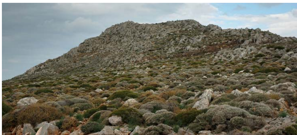
Εικ. 2. Τραόσταλος: Το ανώτερο τμήμα του όρους. Στα αριστερά η βορειοδυτική κορυφή, όπου το μινωικό ιερό. Από ΝΔ.

Το υψηλότερο τμήμα του Τραόσταλου έχει τη μορφή ενός επιμήκους εξάρματος με δύο κορυφές – μία στο μέσον του και μία στα βορειοδυτικά (Εικ. 2). Οι πλαγιές της πρώτης είναι