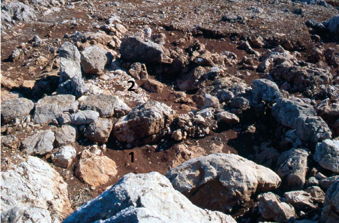
Εικ. 4. Κτίσμα Α. Όπου 1: δυτικός χώρος – το επίμηκες οίκημα· 2: ανατολικός χώρος – η πιθανή αυλή. Από Δ.

που όριζε το ισόπεδο της κορυφής προς τα βορειοανατολικά. Αμέσως χαμηλότερα εκτείνεται το Κτίσμα Α, που αποτελούσε μάλλον ένα μονόχωρο οίκημα με αυλή (Εικ. 4). 4 Το Κτίσμα Β, ένα κτήριο ή περίφραγμα τετράπλευρης κάτοψης, βρίσκεται στο νότιο άκρο της πλαγιάς μεταξύ των δύο ισόπεδων. Τέλος το Κτίσμα Γ εντοπίζεται στην πλαγιά προς τα νοτιοανατολικά της κορυφής. Πρόκειται για ένα αντέρεισμα από ογκόλιθους, που όριζε ίσως ένα υπαίθριο άνδρηρο· εναλλακτικά ο τοίχος μπορεί να συγκρατούσε την κρηπίδα ενός επιμήκους κτηρίου.