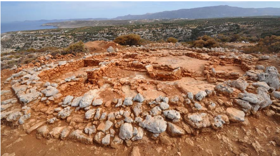
Εικ. 4. Μεσοράχη. Το ΠΜ ΙΒ κτίριο στη θέση 7 (M. Eaby).

Σε μία από αυτές, στη θέση 7, ανασκάφηκε ένα ασυνήθιστο κτίριο χωρίς γωνίες, το οποίο είναι από τα πρωιμότερα ολοκληρωμένα αυτόνομα κτίσματα που καταγράφονται στην Κρήτη. Έχει σχήμα ωοειδές με διαστάσεις 13 \times 18 μ., που είναι διπλάσιες από εκείνες των σύγχρονων