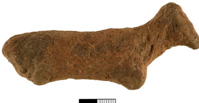
Εικ. 5. Τράχηλας. ΜΜ ΙΙ ζωόμορφο ειδώλιο (Χρ. Παπανικολόπουλος).

κατοικιών σε κοντινές θέσεις. Στο δωμάτιο 5 του κτιρίου θάφτηκε ένας νέος άνθρωπος χωρίς κτερίσματα. Τόσο το σχήμα της κατοικίας όσο και η ταφή στο εσωτερικό της είναι ασυνήθιστα για την Α. Κρήτη. Κατά την ανασκαφή του εντοπίστηκε όλη η οικοσκευή in situ . Οι εσωτερικοί τοίχοι ορίζουν επτά χώρους, οι οποίοι περιείχαν πλήρη σειρά λίθινου και πήλινου εξοπλισμού πάνω σε λιθόκτιστα επίπεδα και θρανία. Στο Δωμάτιο 1 γινόταν η επεξεργασία της τροφής, η προετοιμασία του φαγητού και φυλάσσονταν πολλά οικιακά σκεύη. Τα Δωμάτια 2, 3, και 6 είχαν εστίες ανοικτές και λακκοειδείς, πιθανότατα για την υποστήριξη των σκευών χωρίς πόδια. Το δωμάτιο 2 είχε την πιο σύνθετη διάταξη, με δύο υπερυψωμένα από το δάπεδο έδρανα πλαισιωμένα από θρανία στη βόρεια πλευρά, ένα ιγδίο στην ανατολική, μία εστία στη δυτική, ένα ακόμη θρανίο και μια γωνιακή εστία στο νότιο άκρο. Το Δωμάτιο 3 περιείχε το 85% των μαγειρικών σκευών, που το καθορίζει ως τον κύριο χώρο μαγειρέματος. Τα Δωμάτια 4 και 7 βρέθηκαν σχετικά άδεια και ίσως χρησιμοποιούνταν για την αποθήκευση φθαρτών αγαθών. Η είσοδος του κτιρίου ήταν στη νοτιοανατολική πλευρά του Δωματίου 7 και είχε κατασκευαστεί με κατώφλι και δύο όρθιες πλάκες με τον χαρακτηριστικό «τρίλιθο» τρόπο των θολωτών τάφων. Οι λόγοι εγκατάλειψης του κτιρίου στο τέλος της ΠΜ ΙΒ είναι ακόμη αδιευκρίνιστοι.