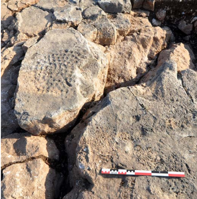
Εικ. 2. Μεσοράχη. Βραχογραφίες στη θέση 8 (M. Eaby).

Η εν λόγω θέση 8 κατοικήθηκε για πρώτη φορά κατά την επόμενη περίοδο, την ΠΜ ΙΑ. Οι ανασκαφές αποκάλυψαν πάνω στα χαράγματα της ΤΝ ένα τετράγωνο κτίσμα κατασκευασμένο με ασυνήθιστα μεγάλους και ορθογώνιους λίθους. Οι διαστάσεις του είναι 13 \times 5 μ., διαθέτει 5-6 χώρους και δύο εξωτερικές αυλές στα βόρεια, με χαμηλούς τοίχους περίφραξης. Τα κυρίως δωμάτια της κατοικίας βρέθηκαν ως επί το πλείστον άδεια λόγω της μετέπειτα χρήσης τους κατά την ΠΜ ΙΙΑ. Η απουσία εισηγμένων αντικειμένων και η σπανιότητα του οψιανού υποδηλώνει ότι δεν υπήρχαν επαφές με τις Κυκλάδες ή ότι αυτές γίνονταν μέσω άλλων παραθαλάσσιων εμπορικών κέντρων που λειτουργούσαν ως πύλες εισόδου, όπως η γειτονική Κεφάλα Πετρά (Paradatos & Tomkins 2013, 365).