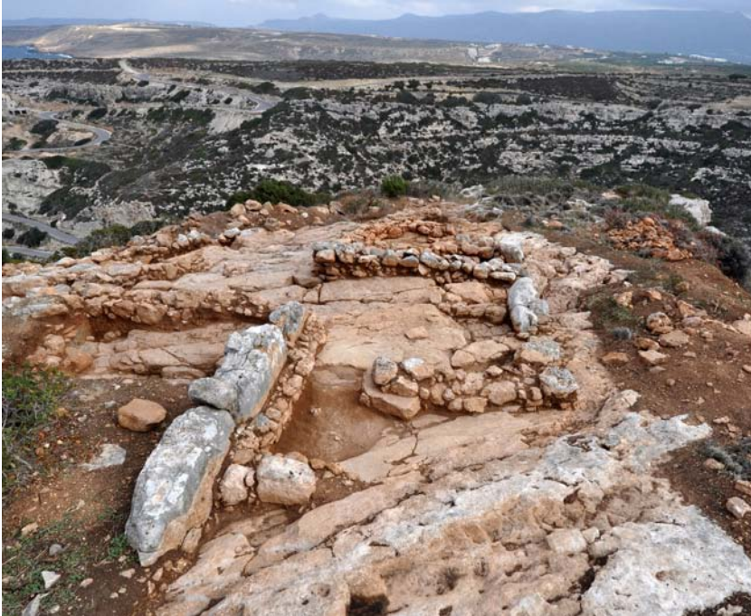
Εικ. 3. Μεσοράχη. Το ΠΜ ΙΑ κτίσμα στη θέση 8 (M. Eaby).

Στην ΠΜ ΙΒ οι θέσεις 5 και 8 εγκαταλείφθηκαν και ιδρύθηκαν νέες εγκαταστάσεις στο κέντρο του πλατώματος. Η προτίμηση θέσεων απομακρυσμένων από τη θάλασσα έρχεται σε αντίθεση με την επικρατούσα εκείνη την περίοδο τάση της υπόλοιπης Κρήτης για ίδρυση οικισμών στα παράλια, ως αποτέλεσμα της άνθησης του θαλάσσιου εμπορίου.